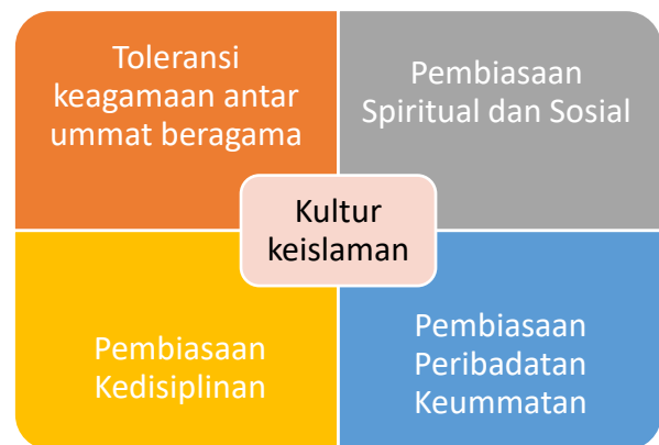
Gambar1. kultur SMK Muhammadiyah 7 Purwoharjo