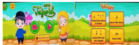
Gambar 2. Game Secil Pendukung Pembelajaran Tajwid Digital

Setelah tahap pengembangan, konten digital diujicobakan dengan sejumlah siswa untuk mendapatkan umpan balik. Hasil dari uji coba ini digunakan untuk melakukan perbaikan dan penyempurnaan. Konten yang telah siap kemudian diintegrasikan dengan platform pembelajaran yang telah ada di MI Miftahul Islam. Pengembangan konten digital mampu memberikan dukungan terhadap lembaga dan guru dalam mengaplikasikan pembelajaran kepada siswa sehingga tujuan yang diharapkan dapat diraih sesuai harapan (Saleha et al., 2022).