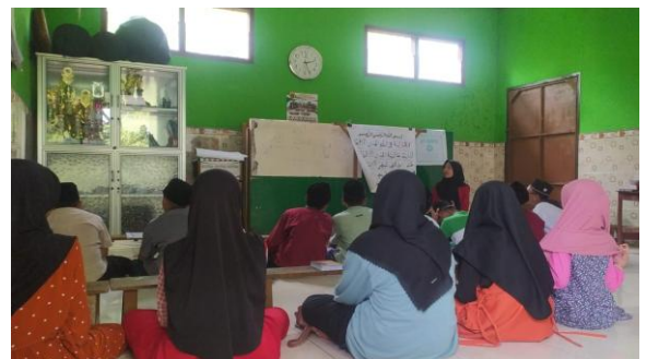
Gambar 1. Guru menampilkan media bacaan Tajwid