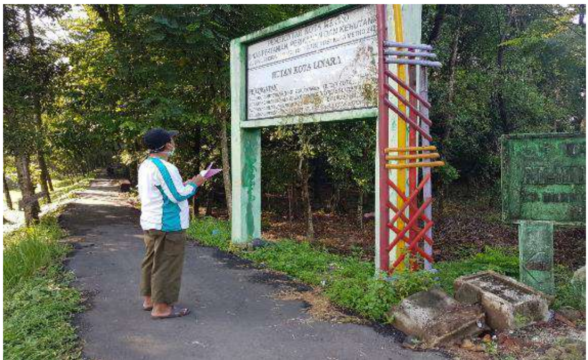
Gambar 2. Papan nama pada gerbang barat Hutan Linares kota Metro.