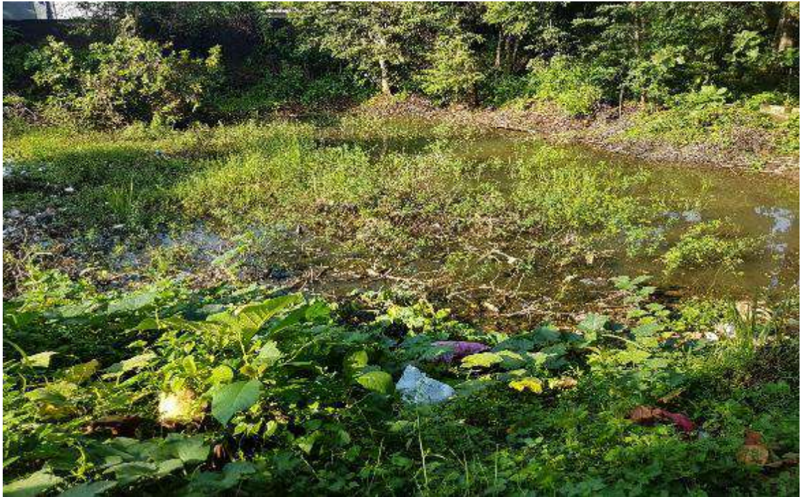
Gambar 8. Lahan yang masih terbuka belum ditanami pada Utara Hutan Linara bagian Timur (Sumber: dokumentasi pribadi).