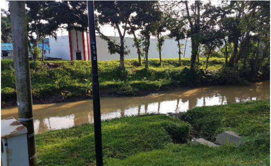
Gambar 5. Sungai bunut di sisi Utara Hutan Linara kota Metro (Sumber: dokumentasi pribadi).