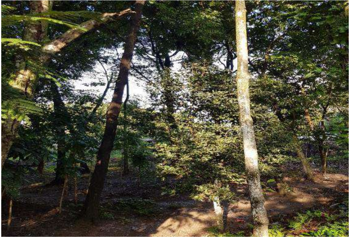
Gambar 3. Vegetasi arboreal Hutan Linara kota Metro bagian tengah (Sumber: dokumentasi pribadi).