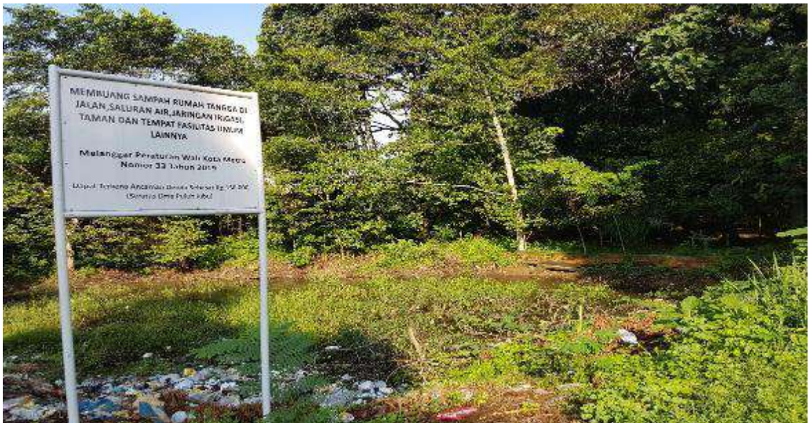
Gambar 7. Lahan yang masih terbuka belum ditanami pada Utara Hutan Linares bagian Timur menjadi tempat pembuangan sampah liar..