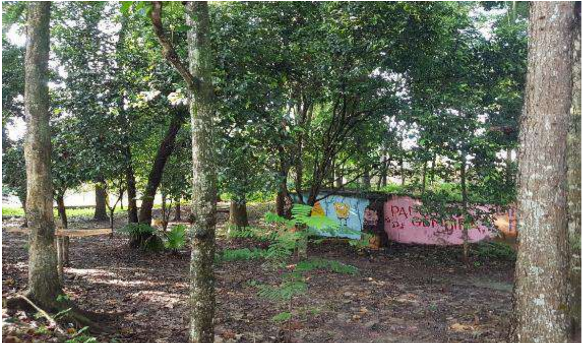
Gambar 7. Lokasi bagian timur Hutan Linares Kota Metro yang longgar memudahkan siswa belajar.