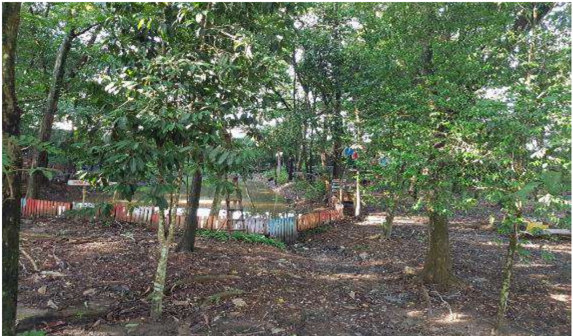
Gambar 4. Kolam Hutan Linara kota Metro (Sumber: dokumentasi pribadi).