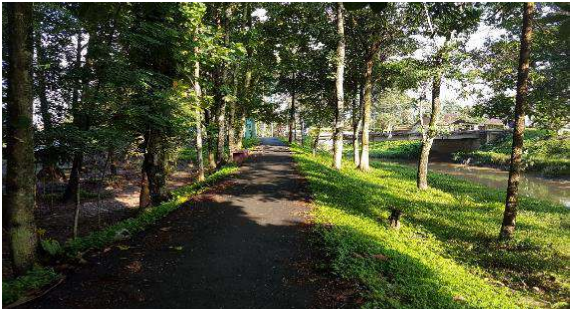
Gambar 6. Jalan beraspal mempermudah akses di utara Hutan Linara kota Metro.