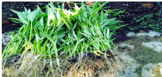
Gambar 1. Tanaman Kangkung Darat

Menurut Irawati (2013) menyatakan bahwa sayuran ini dapat tumbuh dengan baik di pekarangan rumah, maupun areal persawahan. Kangkung juga dapat hidup dengan baik di daratan tinggi maupun daratan rendah sehingga hampir di seluruh tanah air tanaman ini dapat dibudidayakan. Secara fisik tanaman kangkung darat dapat ditunjukkan sebagai berikut: