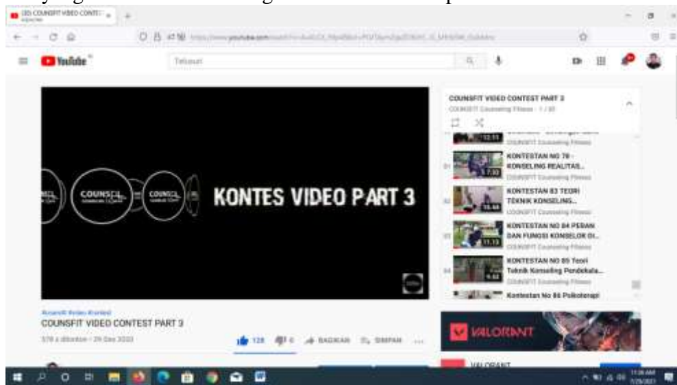
Gambar 1. Hasil kegiatan playlist yang mengikuti kontes counsfit part 3 nampak peserta kurang lebih mencapai 85 peserta yang mengikuti kontes

Hasil penelitian ini adalah berdasarkan analisis deskriptif data diperoleh melalui seberapa banyak kontestan yang mengikuti kontes pada counsfit video contest part 3 : https://www.youtube.com/c/COUNSFITCounselingFitness : berikut adalah hasil yang diperoleh mahasiswa yang antusias dalam mengikuti kontes data di peroleh dari Youtube Counsfit