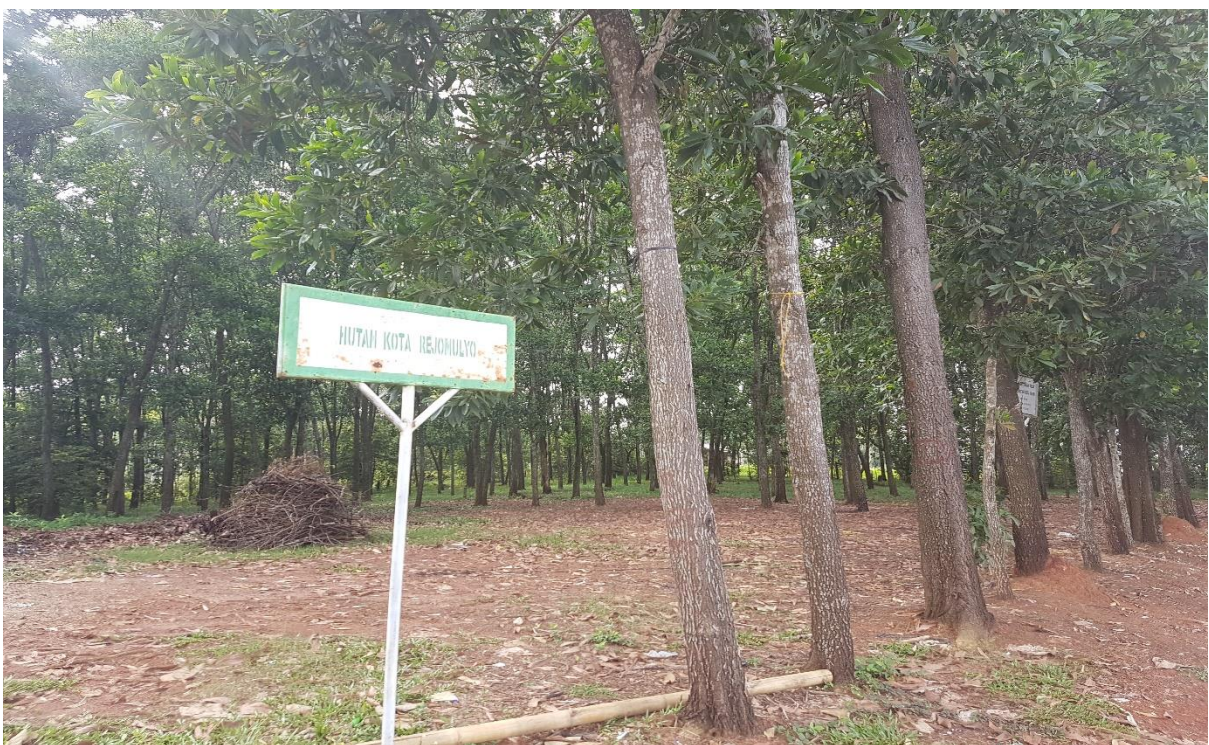
Gambar 2. Papan nama pada lokasi Barat Hutan Rejomulyo Kota Metro.