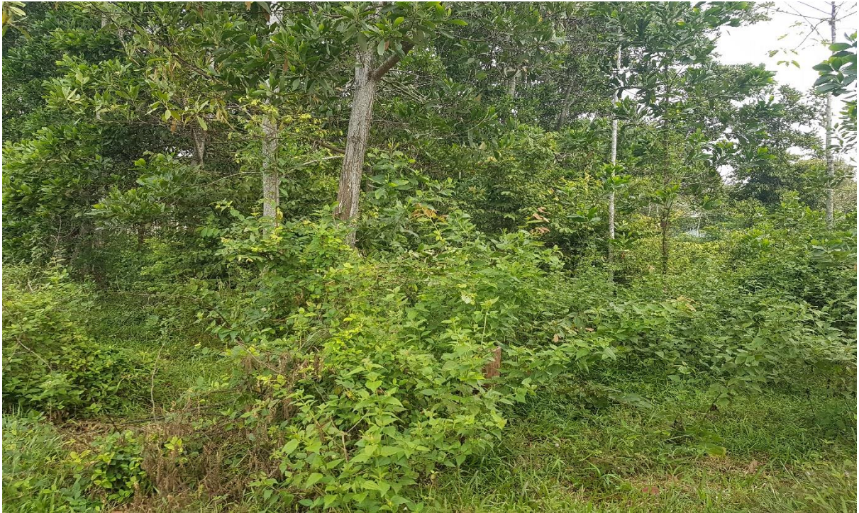
Gambar 3. Vegetasi herba, frutex, dan arboreal Hutan Rejomulyo Kota Metro bagian Selatan (Sumber: dokumentasi pribadi).