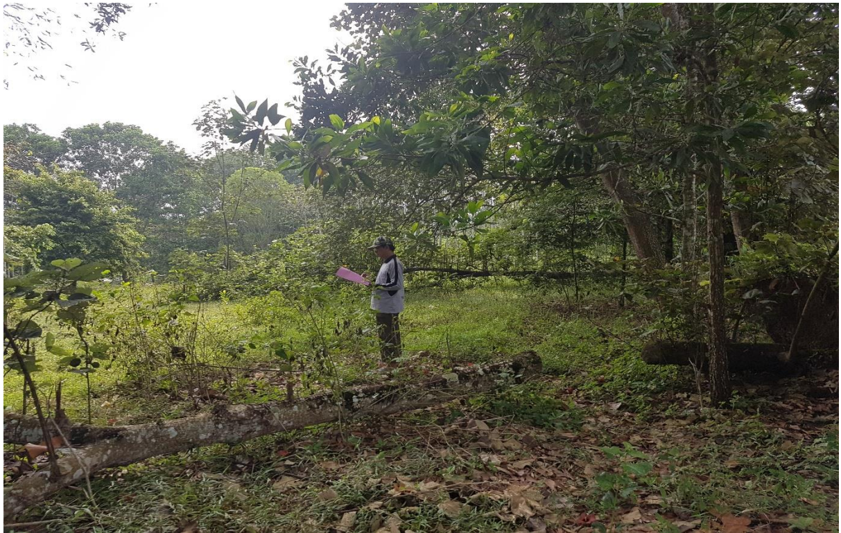
Gambar 5. Observasi bagian tengah Timur Hutan Tejosari Kota Metro.