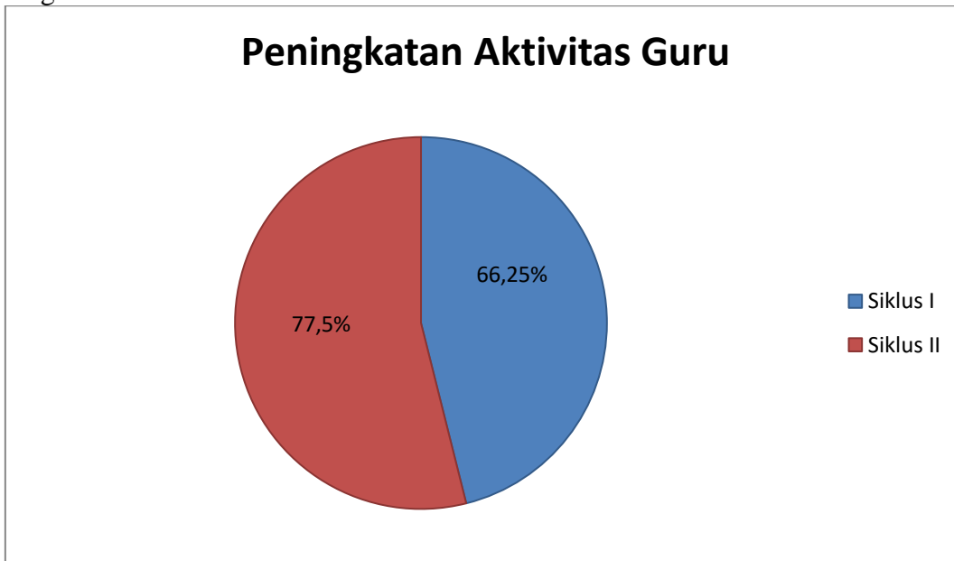
Gambar 2. Diagram Peningkatan Aktivitas Guru

sedang. Aktivitas guru pada siklus II memperoleh rata-rata skor 31 dengan persentase 77,5% dan memperoleh predikat tinggi. Peningkatan aktivitas guru dapat dilihat pada diagram berikut ini.