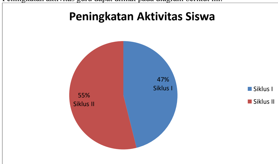
Gambar 3. Diagram Peningkatan Aktivitas Siswa

Berdasarkan hasil observasi aktivitas siswa siklus II pada tabel 9 pertemuan I dan II diperoleh jumlah skor yaitu 619 dengan rata-rata kelas 309,5 dengan persentase 75% dan memperoleh predikat cukup. Hal ini terlihat saat siswa mulai aktif untuk berdiskusi dalam kelompok. Siswa terlihat lebih percaya diri saat berpendapat dan bertanya dan siswa lainnya juga terlihat lebih menghargai teman kelompoknya atau kelompok lain saat berpendapat dan bertanya. Siswa juga lebih rajin untuk mencatat materi pembelajaran. Peningkatan aktivitas guru dapat dilihat pada diagram berikut ini.