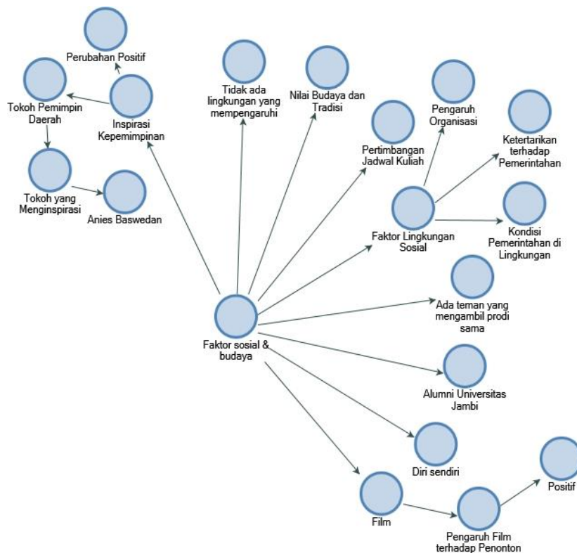
Gambar 2. Faktor sosial dan budaya, Sumber: Diolah melalui Nvivo 12 Plus, 2023

Gambar project map dibawah ini menunjukkan bahwa faktor sosial dan budaya memainkan peran penting dalam keputusan mahasiswa memilih program studi Ilmu Pemerintahan. Faktor-faktor ini dapat dikategorikan sebagai berikut :