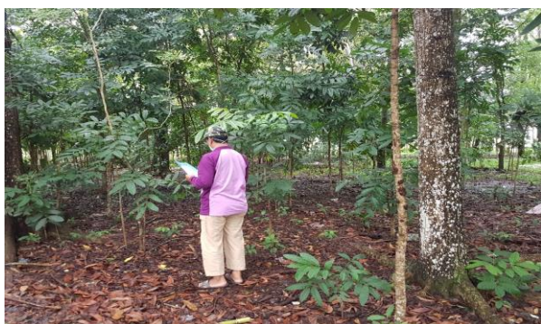
Gambar 5. Observasi bagian tengah Selatan Hutan Tejosari Kota Metro (Sumber: dokumentasi pribadi).