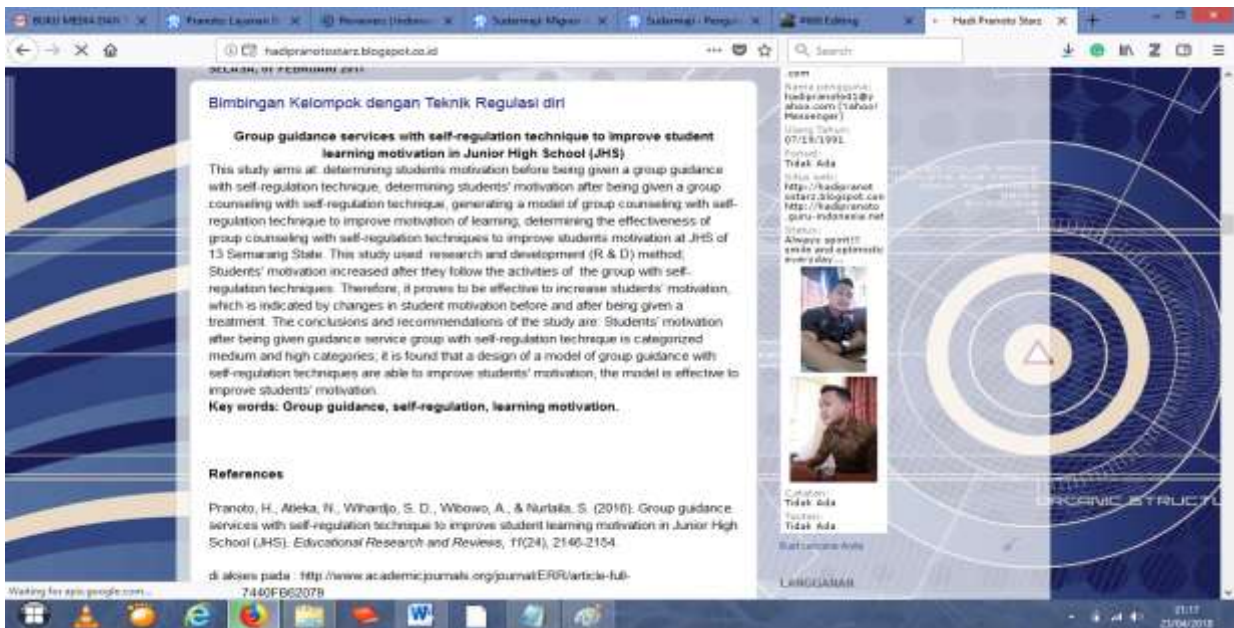
Gambar 2. Pelaksanaan Materi Layanan Bimbingan kelompok