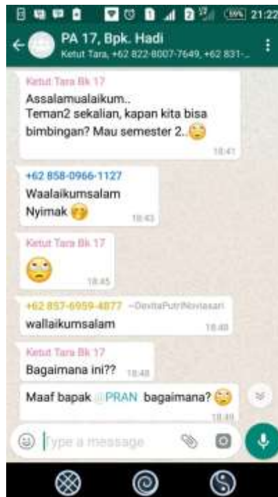
Gambar 4. Pelaksanaan Layanan Bimbingan Kelompok dengan menggunakan Whatsapp