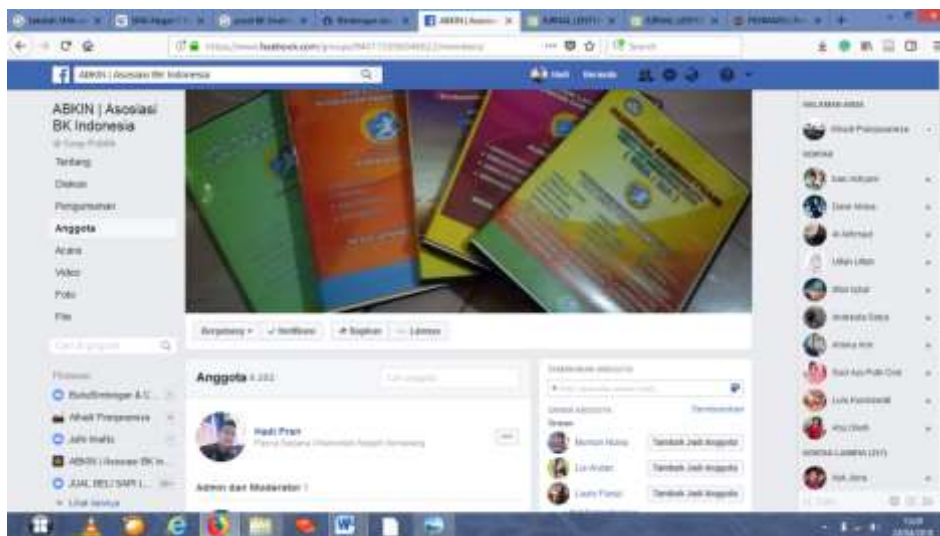
Gambar 4. Pelaksanaan Layanan Bimbingan Kelompok dengan menggunakan Facebook