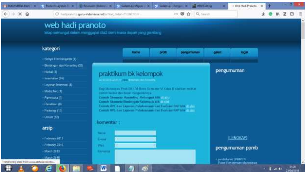
Gambar 3. Pelaksanaan Layanan dengan berbantuan Web