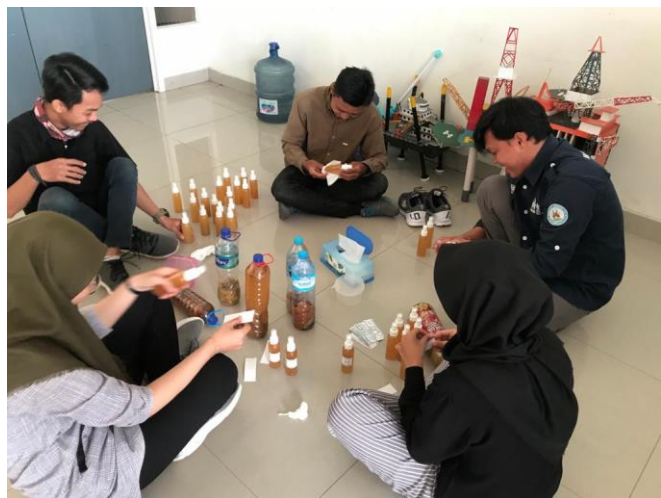
Gambar 6. Penempelan sticker pada botol sampel (produk jadi)

Eco-enzyme yang dibuat bisa digunakan sebagai cairan pembersih lantai kamar mandi, desinfektan, pengusir hama, dan pupuk cair tanaman. Namun untuk penggunaan pupuk cair tanaman masih perlu ditambahkan air. Menurut Ramadani et.al (2018) , penggunaan eco-enzyme sebagai pupuk cair tanaman dapat mempengaruhi bentuk morfologi tanaman seperti warna daun menjadi lebih hijau; ukuran daun, buah, dan diameter batang juga menjadi lebih