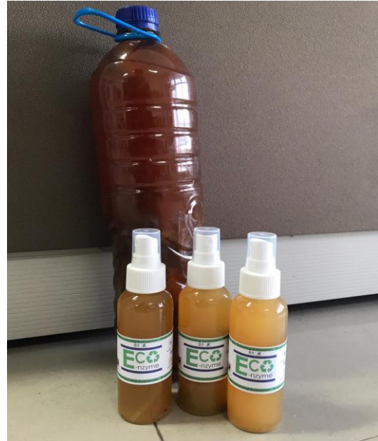
Gambar 5. Produk jadi (siap pakai)