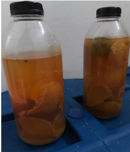
Gambar 4. Varian jeruk (fermentasi 3 minggu)

dikeringkan, dicacah/dihaluskan lalu dikuburkan dalam tanah sehingga bisa berfungsi sebagai pupuk alami.