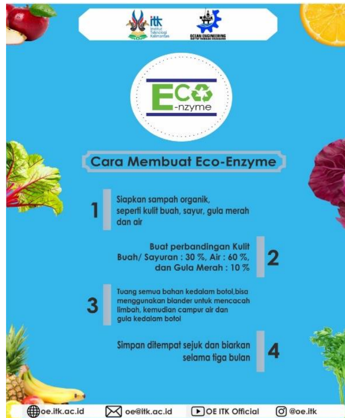
Gambar 2. Cara Pembuatan Eco-Enzyme

kg sampah sayur/buah : 1 kg gula merah : 10 liter air) namun untuk lebih memudahkan pembuatan dalam jumlah kecil bisa menggunakan perbandingan persen seperti yang ada pada gambar 2.