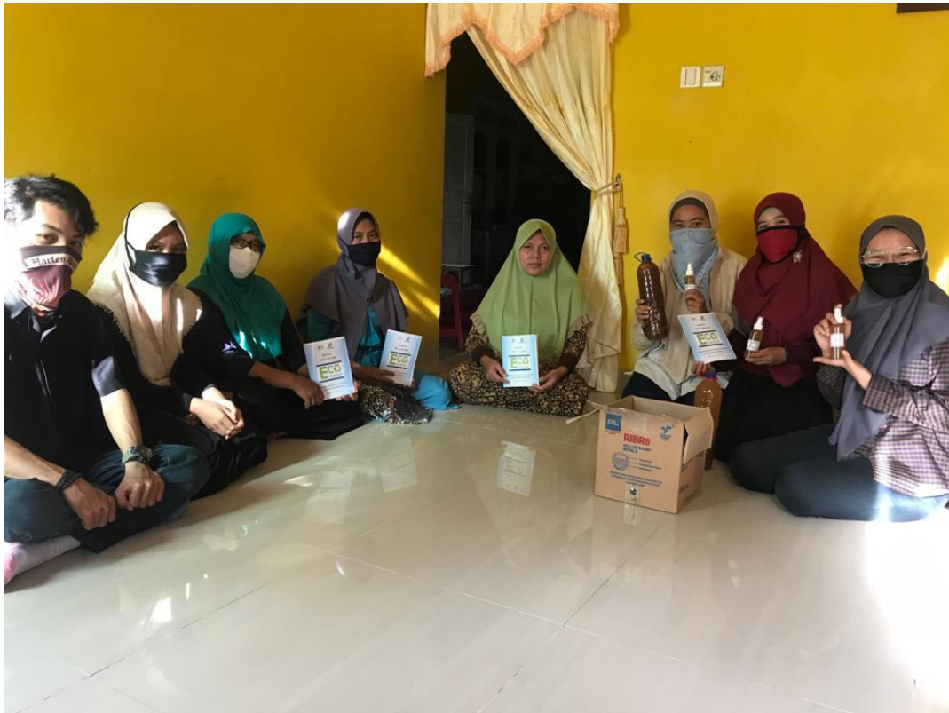
Gambar 3. Kegiatan sosialisasi serta pembagian sampel produk dan modul

grup WhatsApp) untuk mengontrol proses pembuatannya. Selama proses fermentasi perlu dilakukan pengecekan dengan membuka wadah agar gas yang dihasilkan bisa dikeluarkan.