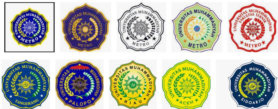
Gambar 1. Logo Kampus yang Terlihat Mirip dan Sulit Dikenali

Materi kedua yang dipaparkan pemateri kedua Agil Lepiyanto, M.Pd. mengenai Strategi Peningkatan Mutu PPDB melalui School branding , School branding atau pencitraan sekolah merupakan pembeda atau penciri khas sekolah satu dengan sekolah lainnya, branding biasa dibuat dengan citra visual yang mudah direkam oleh khalayak ramai. Seperti logo sekolah, dapat dibuat ciri khas yang mudah dikenali.