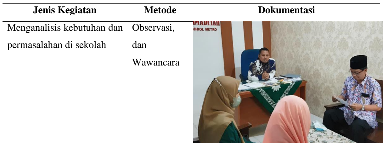
Tabel 1. Tahapan Perencanaan Pengabdian di MA Muhammadiyah Boarding School Metro