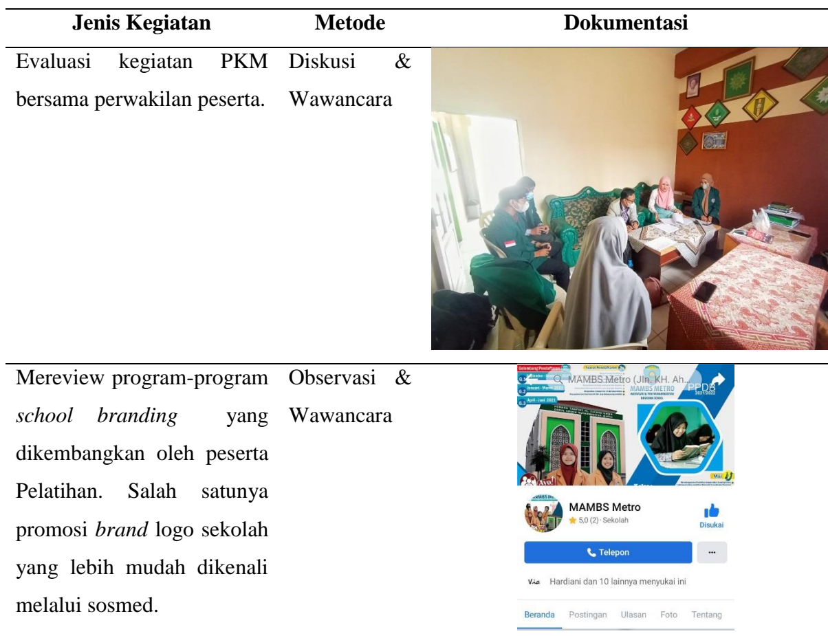
Tabel 3. Tahapan Evaluasi Pengabdian di MA Muhammadiyah Boarding School Metro