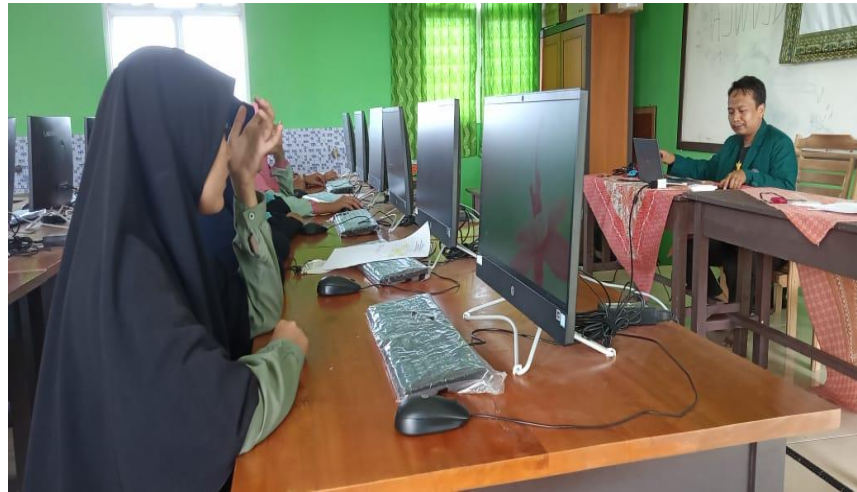
Gambar. 4 Antusiasme santri belajar Aplikasi Wondershare Filmora X

Secara garis besar Metode pelaksanaan program pengabdian masyarakat ini adalah pelatihan yang meliputi kegiatan :