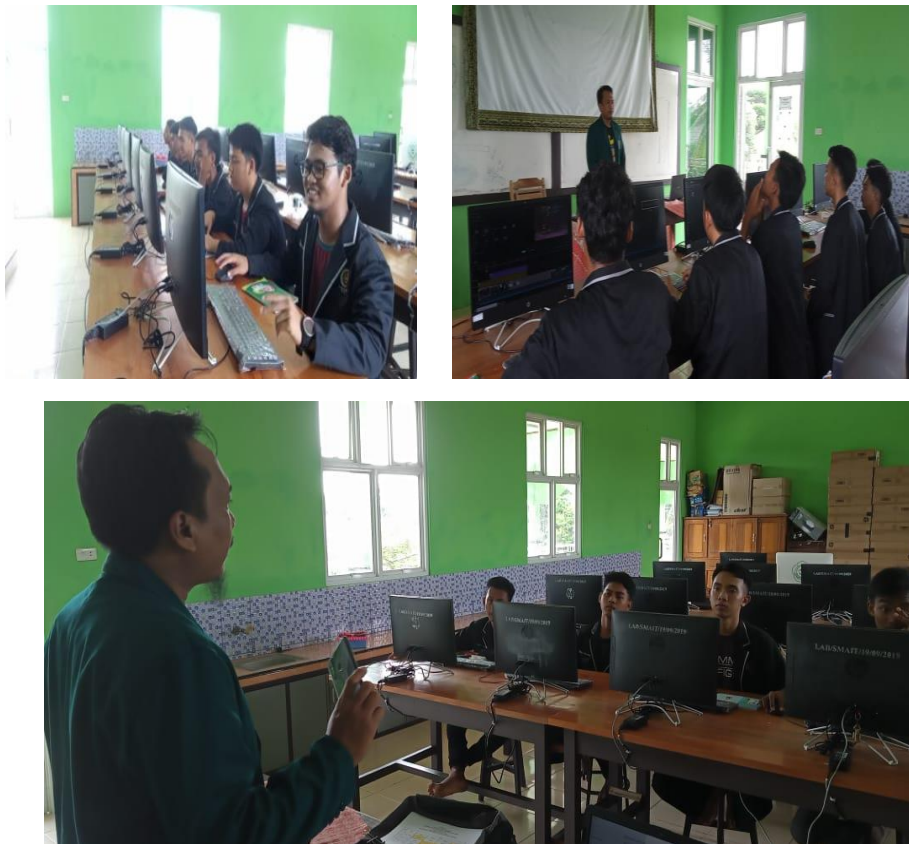
Gambar 3. Dokumentasi saat santri praktik

Setelah santri memiliki foto dan video kemudian dilanjutkan dengan proses pengeditan dalam bentuk audio visual. Dan di akhir evaluasi santri diberikan tugas untuk membuat video kegiatan santri dan kultum santri untuk dijadikan materi pembelajaran dan dakwah.