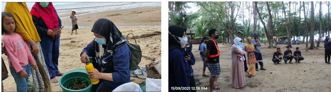
Gambar 6. Demonstrasi dekomposter sampah – Ocean Day 2021

Hasil monitoring/kunjungan yang dilakukan setelah kegiatan, terlihat bahwa Pantai Cemara sudah banyak kemajuan. Terlihat lebih menarik, bersih serta fasilitas dan lahan untuk kegiatan outdoor mulai bertambah. Pengunjung sudah meningkat bahkan sudah ada beberapa event besar yang telah dilakukan di Pantai tersebut.