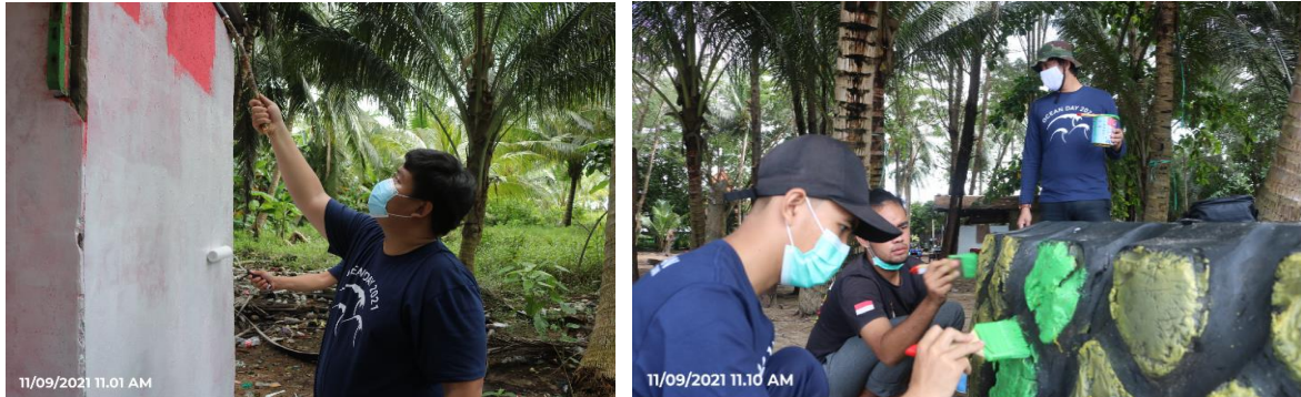
Gambar 5. Pengecatan dan penataan fasilitas – Ocean Day 2021

yang diberikan kepada masyarakat terkait masalah lingkungan (suasana), khususnya pengelolaan sampah dimana hal tersebut menjadi faktor penting dan berpengaruh dalam pengembangan pariwisata (Wiyandhita & Koswara, 2017)