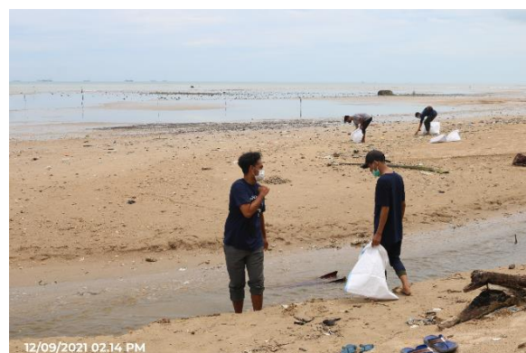
Gambar 4. Aksi bersih pantai bersama warga sekitar – Ocean Day 2021

Selain itu, dilakukan sosialisasi penanganan sampah dengan metode komposter kepada masyarakat setempat (Gambar 6). Kegiatan ini menjadi salah satu bentuk edukasi