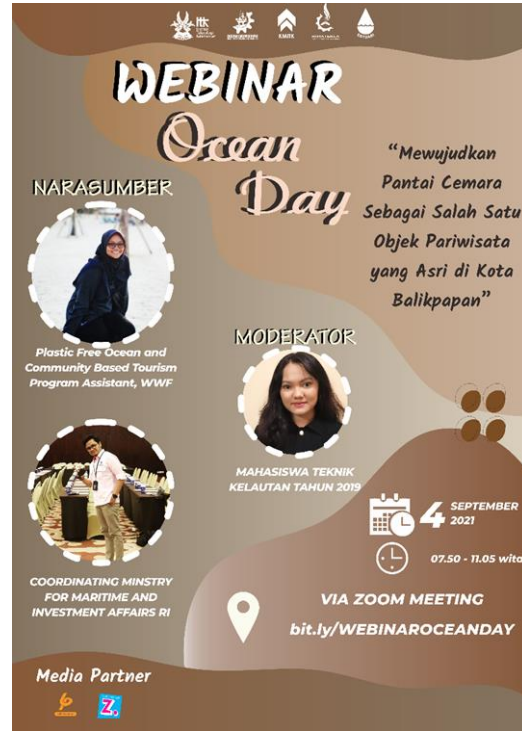
Gambar 2. Poster Webinar Ocean Day 2021