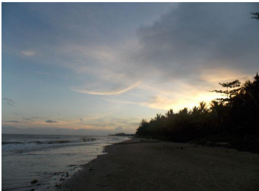
Gambar 3. Senja di Pantai Cemara, karya pemenang Lomba Fotografi – Ocean Day 2021