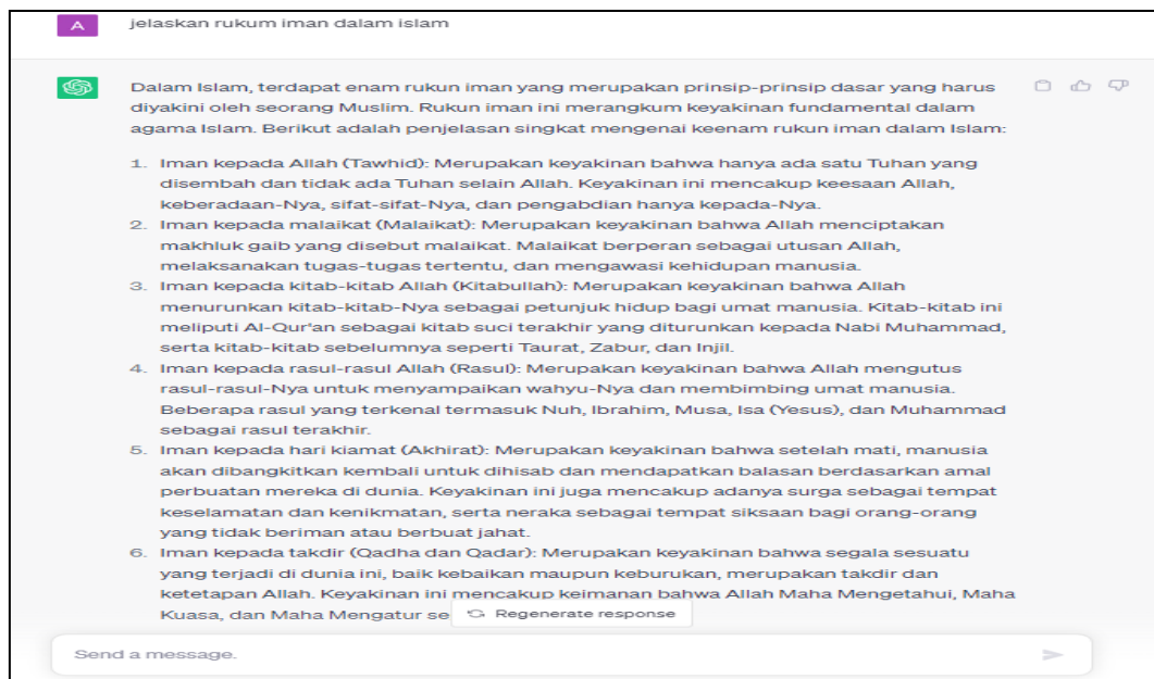
Gambar 5. Response Chat GPT ketika bertanya tentang Materi Keislaman

Selain itu peserta juga dapat mengakses chat GPT dengan memberikan soal yang beraneka ragam serta chat GPT akan memberikan response jawaban.