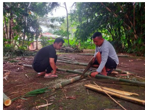
Gambar 2. Persiapan Inovasi Kebun KWT bersama Warga