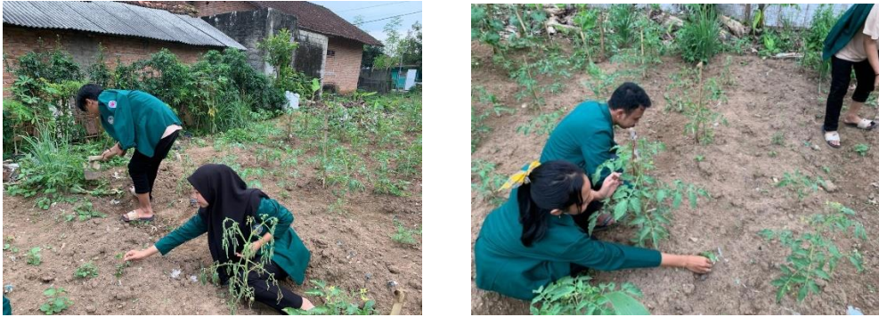
Gambar 3. Melakukan perawatan di kebun KWT.

kebun KWT (Purwandhani, et.al., 2019) ini dikarenakan jika hasil dan potensi dari kebun ini sedikit terlihat pasti akan ada banyak hal yang bisa dikembangkan.