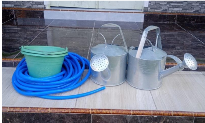
Gambar 1. Alat – alat di Kebun KWT