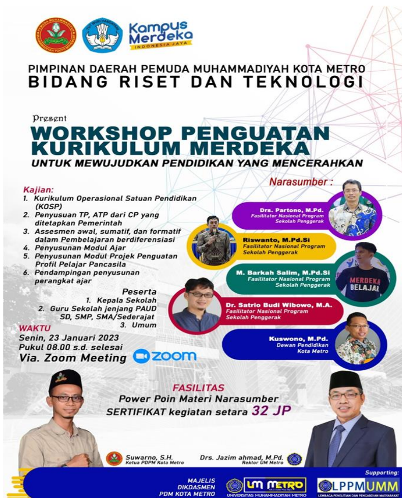
Gambar 1. Flyer Pelatihan Implementasi Kurikulum Merdeka

Pelatihan ini bertujuan untuk meningkatkan kualitas pembelajaran dan partisipasi masyarakat dalam konteks Kurikulum Merdeka. Materi pelatihan mencakup kebijakan pemulihan pembelajaran, kurikulum operasional satuan pendidikan, pembelajaran dan penilaian, penguatan profil pelajar Pancasila, peran bimbingan dan konseling, platform Merdeka Mengajar dan aktivasi akun Belajar.id, komunitas belajar, serta mekanisme penyediaan buku Kurikulum Merdeka.