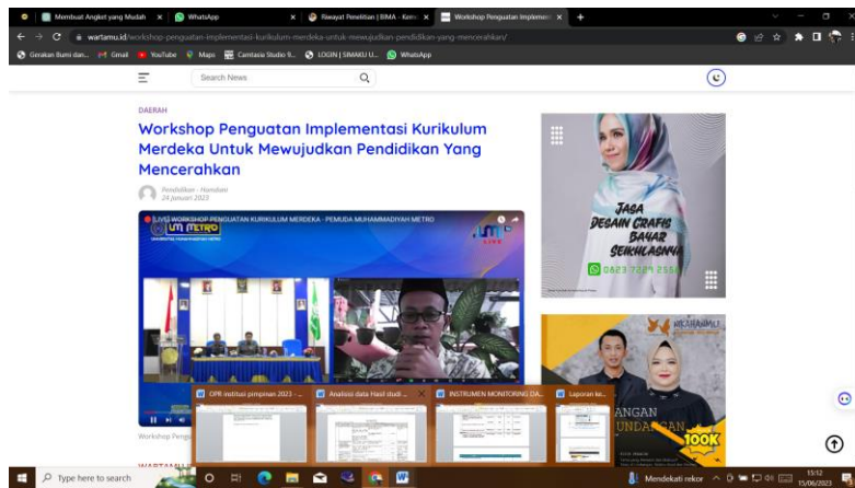
Gambar 2.b Publikasi pada Wartamu

( https://www.wartamu.id/workshop-penguatan-implementasi-kurikulum-merdeka-untuk-mewujudkan-pendidikan-yang-mencerahkan/ )