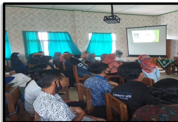
Gambar 3. Kegiatan training motivasi

Adapun dokumen kegiatan sebagai berikut: