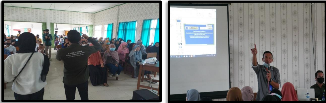
Gambar 4. Dokumentasi Kegiatan Training Motivasi

Setelah melaksanakan kegiatan selama sekitar satu bulan, maka diperoleh hasil kegiatan sebagai berikut: