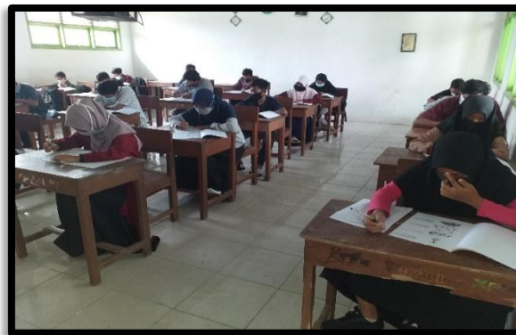
Gambar 3. Pelaksanaan Asesment

Dokumentasi kegiatan assessment dapat dilihat pada gambar berikut: