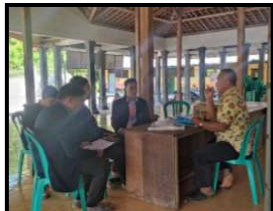
Gambar1. Wawancara kepada pengurus desa 1A dan wawancara kepada kepala desa 1B