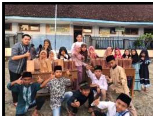
Gambar 7. Kegiatan lomba TPA

Selain itu, perlombaan di TPA Darul Muttaqien Desa Ngadirojo juga menjadi sarana untuk memotivasi siswa dalam meningkatkan prestasi dan keseriusan mereka dalam pembelajaran agama. Dengan adanya perlombaan, siswa dihadapkan pada tantangan yang dapat mendorong mereka untuk terus belajar dan meningkatkan kemampuan mereka dalam beribadah. Perlombaan ini juga dapat membantu meningkatkan rasa percaya diri siswa ketika mereka berhasil meraih prestasi dalam berbagai bidang yang berkaitan dengan agama Islam.