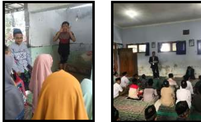
Gambar 3. Kegiatan praktek wudhu 3A dan praktek sholat 3B

setiap kalimat adzan dan hikmah di baliknya, siswa dapat lebih merasakan kedalaman spiritual dalam menjalankan ibadah. Selain itu, pembelajaran ini juga mengajarkan nilai-nilai seperti kedisiplinan dan tanggung jawab, karena adzan membutuhkan ketepatan waktu dan ketelitian dalam pelaksanaannya. Dengan demikian, pembelajaran praktik ibadah amaliyah menjadi pondasi yang kuat dalam membangun kesadaran dan ketakwaan siswa terhadap agama Islam.