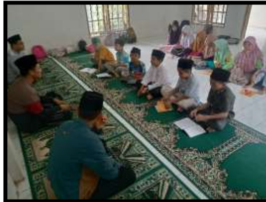
Gambar 4. Kegiatan belajar mengaji di TPA Darul Muttaqien