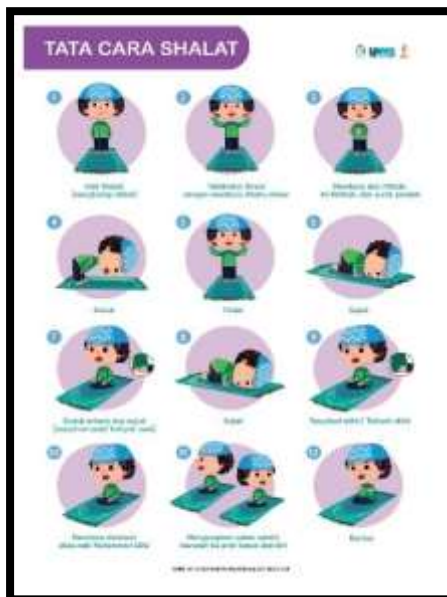
Gambar 8. Wakaf poster tentang tata cara shalat

Melalui wakaf ini, tim KKNT tidak hanya memberikan manfaat dalam jangka pendek, tetapi juga meninggalkan warisan yang bernilai dalam pengembangan keagamaan dan pendidikan di Desa Ngadirojo. Modul pembelajaran dan poster-poster pembelajaran tersebut dapat menjadi sumber pengetahuan yang berkelanjutan bagi masyarakat, serta memberikan kontribusi yang berarti dalam upaya peningkatan pemahaman dan praktik keagamaan di masa yang akan datang.