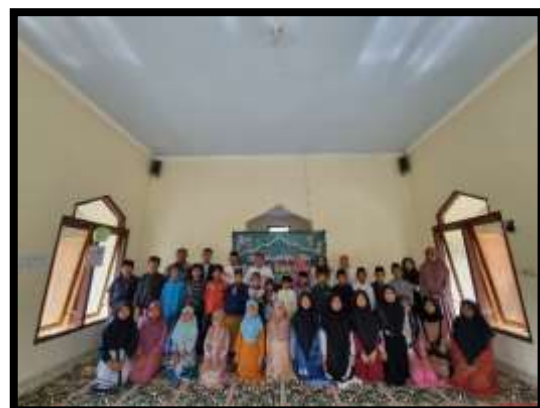
Gambar 6. Kegiatan Tausiyah dalam pondok Romadhon 6A dan foto bersama 6B