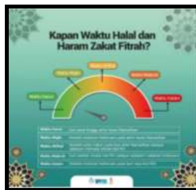
Gambar 11. Wakaf poster tentang waktu unjuk berzakat fitrah