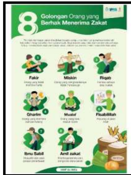
Gambar 10. Wakaf poster tentang golongan yang berhak mendapatkan zakat