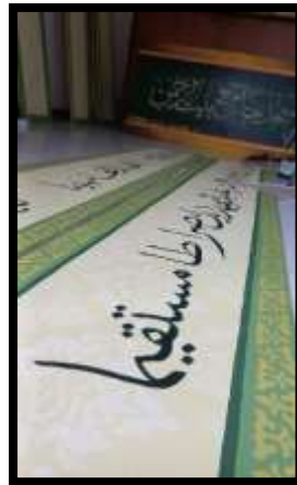
Gambar 13. wakaf kaligrafi untuk hiasan Masjid Darul Muttaqien.