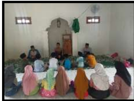
Gambar 2. Kegiatan perkenalan dengan pengajar dan direktur TPA

Selain perkenalan antara pengajar dan siswa, tahap awal pembelajaran juga mencakup pengenalan terhadap lingkungan belajar dan materi-materi yang akan dipelajari. Pengajar memperkenalkan fasilitas-fasilitas di TPA, seperti buku-buku pelajaran, alat tulis, dan ruang belajar. Mereka juga menjelaskan dengan ringkas tentang tujuan pembelajaran serta materi-materi yang akan disampaikan selama periode pembelajaran. Dengan demikian, proses perkenalan ini tidak hanya membangun hubungan antara pengajar dan siswa, tetapi juga mempersiapkan siswa secara mental untuk mengikuti pembelajaran dengan baik.