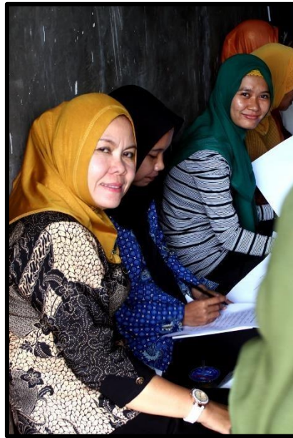
Gambar 4. Peserta sedang mengerjakan posttest

Dari pelatihan ini diperoleh hasil pelatihan berdasarkan hasil evaluasi yang telah dilaksanakan di awal dan di akhir pelatihan. Hasil evaluasi akhir menunjukkan peningkatan pengetahuan peserta tentang pemahaman prinsip-prinsip, manfaat, dan ancaman zat pewarna sintesis dibandingkan dengan evaluasi awal. Data hasil evaluasi awal dan akhir secara ringkas dapat dilihat pada Tabel 2.