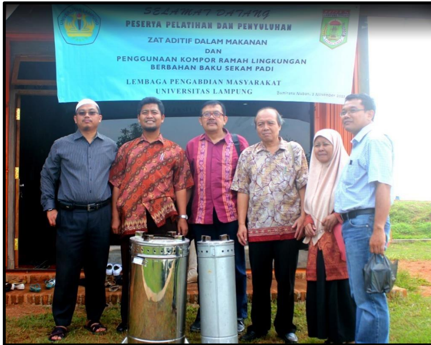
Gambar 2. Tim pengabdian di Desa Wates, Kecamatan Bumi Ratu Nuban, Lampung Tengah