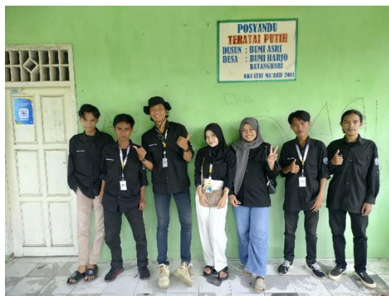
Gambar 5. Pemasangan QR Code Posyandu

Pada gambar 4. Tahap selanjutnya pemasangan Qr Code untuk Masjid pada tiap dusun