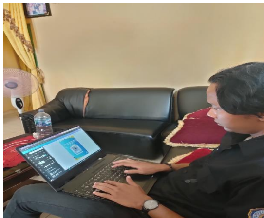
Gambar 2. Pembuatan Bingkai Qr Code

Pada gambar 1. Untuk pembuatan QR Code kami menggunakan situs yaitu qrcode-monkey.com Karena sangat mudah pembuatannya dan bisa ditambahkan untuk logo, logo yang kami gunakan yaitu logo yang kami buat untuk Desa Bumi Harjo