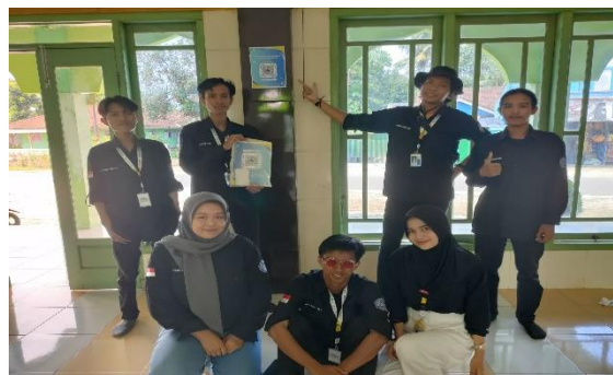
Gambar 4. Pemasangan QR Code Masjid

Pada gambar 3. Selanjutnya Qr Code yang sudah dibuat dicetak menggunakan kertas photo stiker agar bisa dipasangkan pada tiap Posyandu dan Masjid