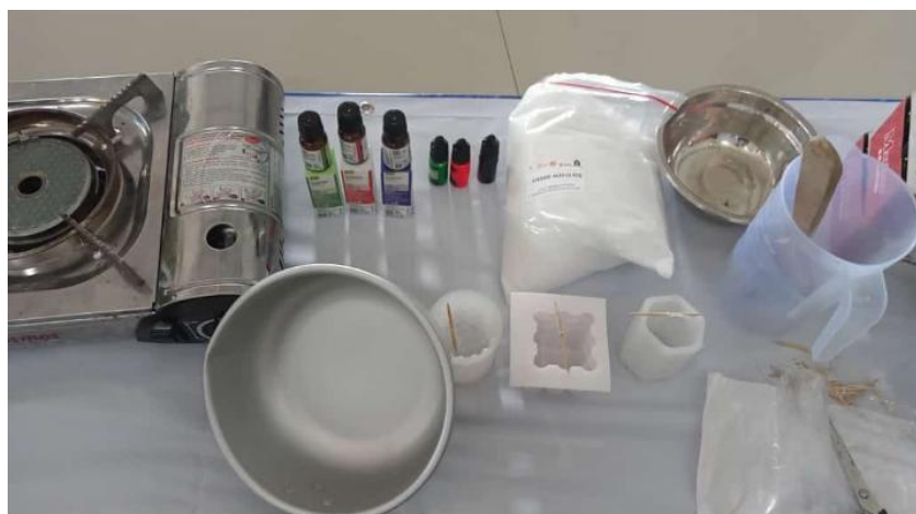
Gambar 2 Persiapan alat bahan

Pada gambar 1, Ira Vahlia dan tim pengabdian memberikan sosialisasi pentingnya pemanfaatan minyak jelantah untuk pembuatan produk yang bernilai ekonomis serta memberikan edukasi dampak dari limbah minyak jelantah. Setelah sosialisasi dan diskusi selesai, kemudian dilanjutkan dengan demonstrasi pembuatan lilin aromaterapi berbahan dasar limbah minyak jelantah. Demonstrasi kali ini dilakukan oleh Sangidatus Sholiha, M.Pd dibantu dengan tim Pengabdian, berikut dokumentasi kegiatan,