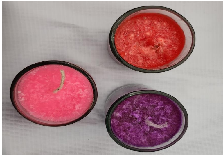
Gambar 5. Lilin Aromaterapi Siap Digunakan

Setelah proses pengadonan selesai, tahap selanjutnya adalah pencetakan. Cetakan disini ada 2 jenis yaitu cetakan dari gelas kaca kecil dan cetakan silicon. Untuk jenis aroma terapi yang dipraktikkan yakni aromaterapi lavender, green tea dan rose . Agar lilin tahan lama, lebih baik menggunakan cetakan gelas kecil. Setelah proses mencetak selesai, maka tahap berikutnya adalah menunggu lilin sampai benar- benar beku dan siap digunakan. Berikut ini contoh lilin aromaterapi dari bahan minyak jelantah yang siap digunakan,