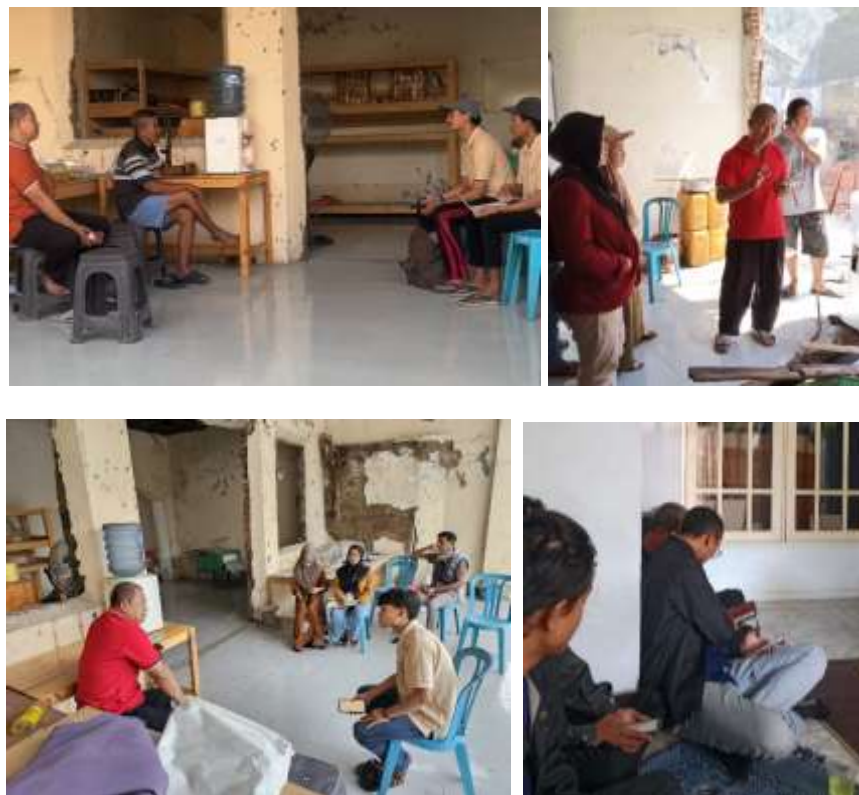
Gambar 4. Pendampingan pembuatan SEO-Media Sosial Facebook dan rebranding Produk Krupuk Tenggiri K57 sebagai saluran promosi online