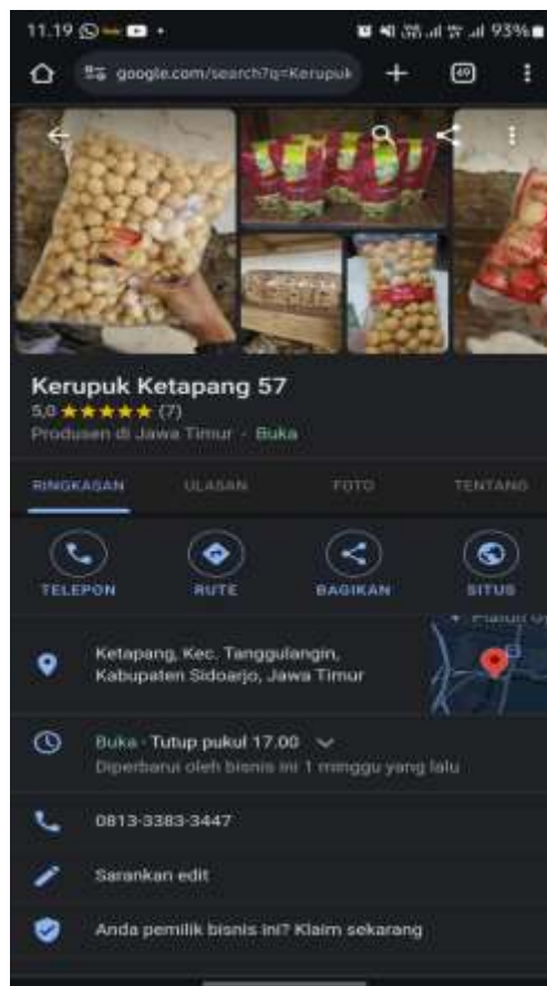
Gambar 2. Hasil pemanfaatan SEO sebagai strategi Digital Marketing