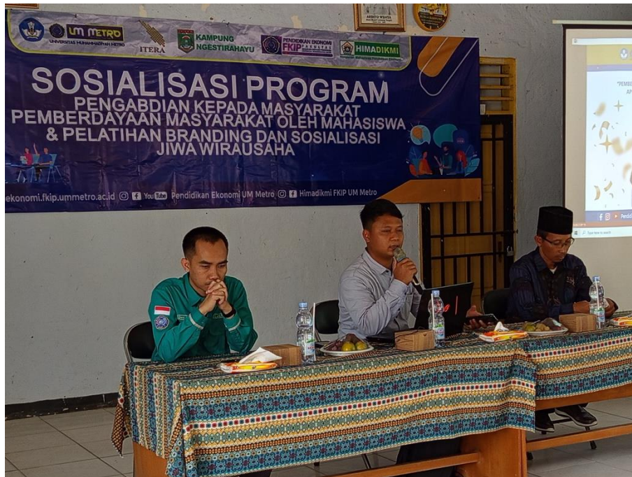
Gambar 2. Sosialisasi Program

Langkah pertama dalam pelaksanaan program kegiatan branding produk KWT adalah penyampaian sosialisasi oleh ketua tim pengabdian. Sosialisasi disampaikan kepada peserta untuk memberikan Gambaran program dan konsep pelatihan sebagai pengetahuan awal.