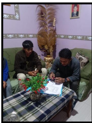
Gambar 1. Kerja sama dengan perangkat desa

Kendala yang dihadapi dalam penjualan kue menyebabkan pendapatan tidak stabil, meskipun ada upaya untuk meningkatkan ekonomi desa. Program arisan bulanan diadakan untuk meningkatkan interaksi dan ide antara pedagang. Selain itu, usaha pertanian sayur sawi juga dijalankan, dengan produk dijual di pasar sambil memasarkan kue KWT. Pembinaan berkelanjutan diharapkan dapat membantu meningkatkan taraf hidup masyarakat desa.