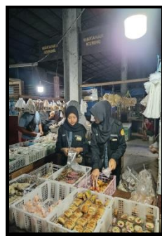
Gambar 3. Kegiatan pemasaran