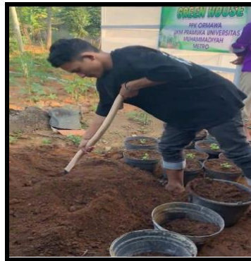
Gambar 6. Persiapan pupuk

Setelah kompos matang, saring untuk memisahkan bahan yang belum terurai sempurna. Pupuk organik yang sudah siap dapat digunakan sebagai pupuk alami untuk tanaman.