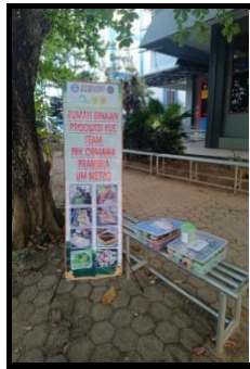
Gambar 2. Kantin kejujuran