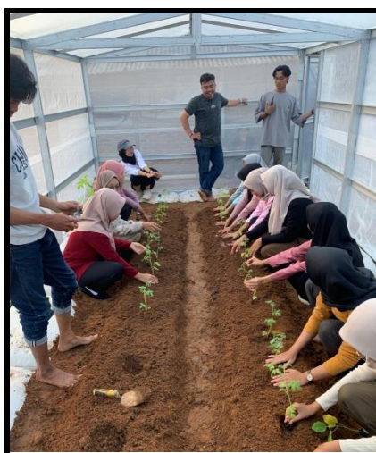
Gambar 5. Penanaman bibit

Melalui program ini, UKM Pramuka UM Metro berharap dapat memberikan kontribusi positif bagi masyarakat Desa Sumber Agung, sekaligus memperkuat hubungan antara kampus dan masyarakat dalam pengembangan pertanian yang berkelanjutan.