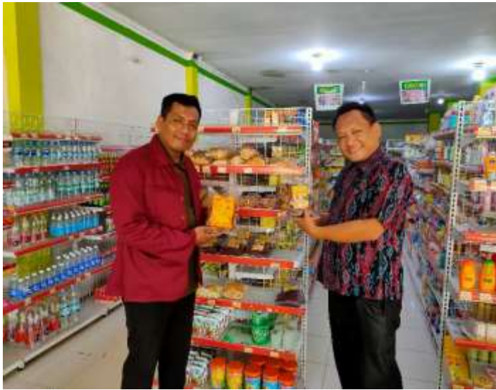
Gambar 5. Stok Opname

(Standard Operating Procedure) yang wajib dilakukan oleh setiap toko. Hal ini dilakukan agar tidak terjadi kesalahan input data ke dalam pencatatan akuntansi terkait jumlah barang yang ada dengan jumlah pada sistem. Selain itu juga untuk meminimalisir terjadinya kehilangan dan kerusakan barang. Dengan adanya stock opname maka, dapat membantu untuk memaksimalkan pelayanan kebutuhan konsumen dengan lebih baik.