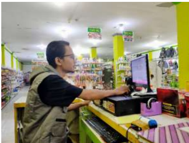
Gambar 6. Budgeting dan perencanaan keuangan

Budgeting atau penganggaran keuangan adalah suatu strategi pengelolaan keuangan yang memastikan jumlah pendapatan dan pengeluaran berjalan dengan seimbang, serta sesuai dengan tujuan finansial yang ingin dicapai. Melihat kondisi penjualan toko yang menurun maka, kami berupaya memberikan saran serta cara penerapannya agar dilakukan proses budgeting keuangan pada TokoMu Bangunrejo. Proses tersebut berupa pembuatan perencanaan keuangan yang meliputi rencana pembelian barang, pembayaran hutang dan pengurangan biaya bulanan yang di anggap tidak terlalu berdampak langsung pada usaha toko tersebut. Dengan cara ini, diharapkan dapat membantu meningkatkan penghasilan bersih toko.