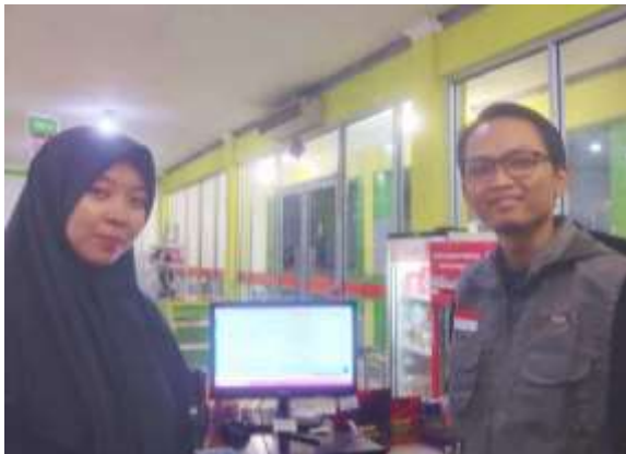
Gambar 9. Monetisasi dan evaluasi akhir

memastikan bahwa semua program kerja telah dilakukan dengan baik dan maksimal sehingga memberikan hasil yang positif bagi toko.