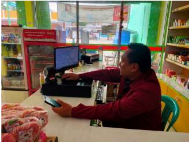
Gambar 4. Pengecekan transaksi

Program selanjutnya yaitu mengidentifikasi pencatatan keuangan secara manual yang dilakukan oleh TokoMu Bangunrejo. Pencatatan segala bentuk transaksi harus didasarkan dengan bukti fisiknya, seperti struk dan kwitansi. Pembuatan kolom beserta keterangannya juga harus benar dan sesuai dengan standar pencatatan akuntansi.