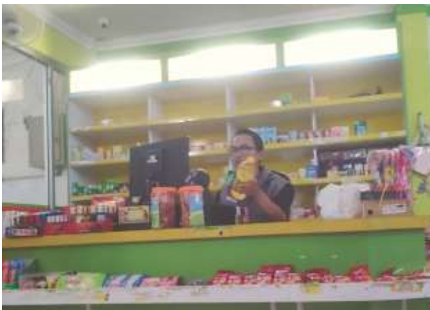
Gambar 7. Penjualan barang pada sistem toko

Analisis kebutuhan pasar merupakan suatu proses terstruktur yang bertujuan untuk mengenali dan memahami keinginan serta preferensi konsumen dalam sebuah pasar. Proses ini mencakup pengumpulan, pengolahan, dan penafsiran data yang berkaitan dengan perilaku pelanggan, tren industri, serta situasi persaingan yang terjadi. Pada Langkah ini, kelompok KKN terlibat langsung dalam proses pelayanan di toko tersebut. Kegiatan ini dilakukan dengan dasar adanya penurunan minat beli konsumen atau masyarakat di TokoMu Bangunrejo.