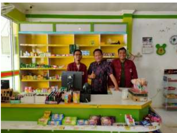
Gambar 8. Monetisasi dan evaluasi awal

Langkah terakhir yang dilakukan yaitu melakukan evaluasi atas semua upaya dan kegiatan yang telah dijalankan. Hal ini dilakukan untuk memastikan keberhasilan program kerja yang telah disusun. Selain itu juga untuk mengukur efektivitas, efisiensi, dampak dan keberlanjutan suatu program. Kegiatan monitoring dan evaluasi dilakukan sebanyak dua kali dalam delapan kali pertemuan dengan mitra. Tujuannya agar lebih efisien dan untuk