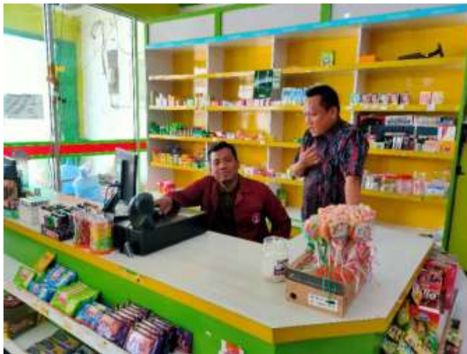
Gambar 3. Pengecekan Laporan Transaksi Penjualan

Aktivitas pertama yang kami jalankan yaitu melakukan pengecekan terkait semua transaksi yang terjadi pada TokoMu Bangunrejo. Pengecekan laporan transaksi dilakukan untuk memastikan keakuratan data dan keandalan informasi keuangan yang disajikan. Semua transaksi yang disajikan harus ada bukti pendukungnya seperti nota, invoice,