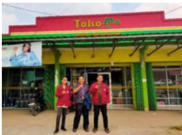
Gambar 2. Sosialisasi Kepada Pihak Toko/Mitra

Hal yang mendasari pemilihan lokasi pelaksanaan Kuliah Kerja Nyata di TokoMu Bangunrejo, Kabupaten Lampung Tengah yaitu karena adanya penurunan daya jual yang dialami oleh toko tersebut sehingga, kami tertarik untuk membantu meningkatkan pendapatan bersih TokoMu Bangunrejo dengan melakukan beberapa upaya yang sudah disusun ke dalam program kerja KKN.