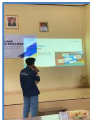
Gambar 3. pemateri menyampaikan beberapa materi pengenalan awal gambar 2A pemateri satu menyampaikan Pengenalan media sosial dan e-commerce., gambar 2B pemateri menjelaskan strategi pemasaran