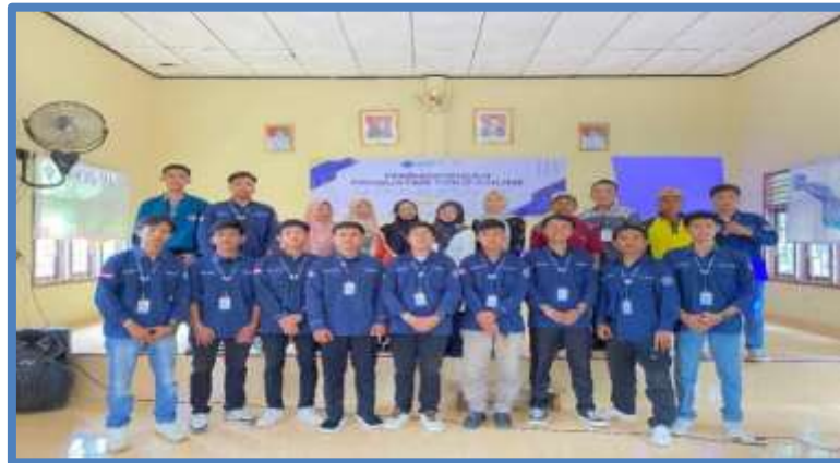
Gambar 2. Tim kkn dan peserta pelatihan

Kegiatan pendampingan pembuatan toko online ini menunjukkan hasil yang signifikan dalam meningkatkan pemahaman dan keterampilan para peserta khususnya pengepul kerajinan dan pengrajin. Tim juga melakukan sesi praktik langsung dan pendampingan terhadap para peserta dalam pembuatan toko akun online, pembuatan deskripsi yang singkat jelas dan baik, pengambilan gambar dan video serta cara pemasaran. Melalui praktik langsung itu peserta dapat mengimplementasikan pengetahuan yang telah diperoleh selama penyampaian materi ke dalam praktik nyata tersebut.