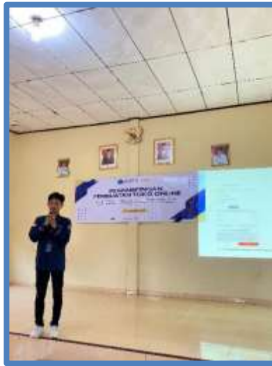
Gambar 4. Penyampaian Langkah pembuatan akun setelah melakukan pemaparan materi

Tim melakukan kuisisioner untuk melihat hasil dari pelatihan pendampingan ini berikut adalah hasil kuisisioner :