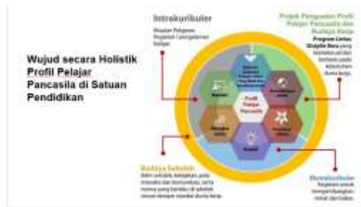
Gambar 3. Materi tentang keterkaitan Holistik Profil Pelajar Pancasila di satuan Pendidikan