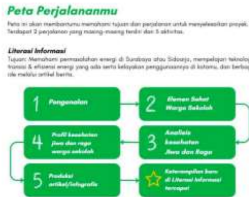
Gambar 6. Skema modul ajar karya guru

Pembentukan keberagaman pada kelompok dapat mendorong sinergi guru dalam menyusun modul ajar (Yolanda dkk, 2023). Meningkatkan komunikasi dan Kerjasama lintas disiplin (Haq, 2023). Membiasakan guru dengan dinamika kerja tim yang mirip dengan situasi nyata saat menerapkan proyek (Hutago dkk, 2023).