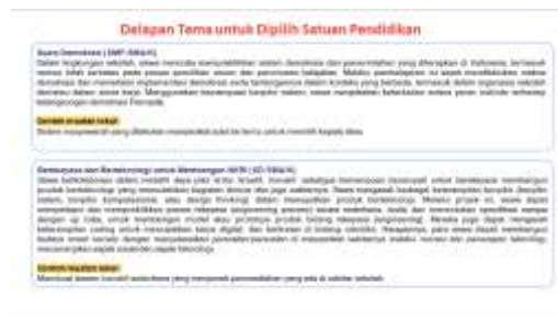
Gambar 4. Menyajikan tema yang dapat disusun