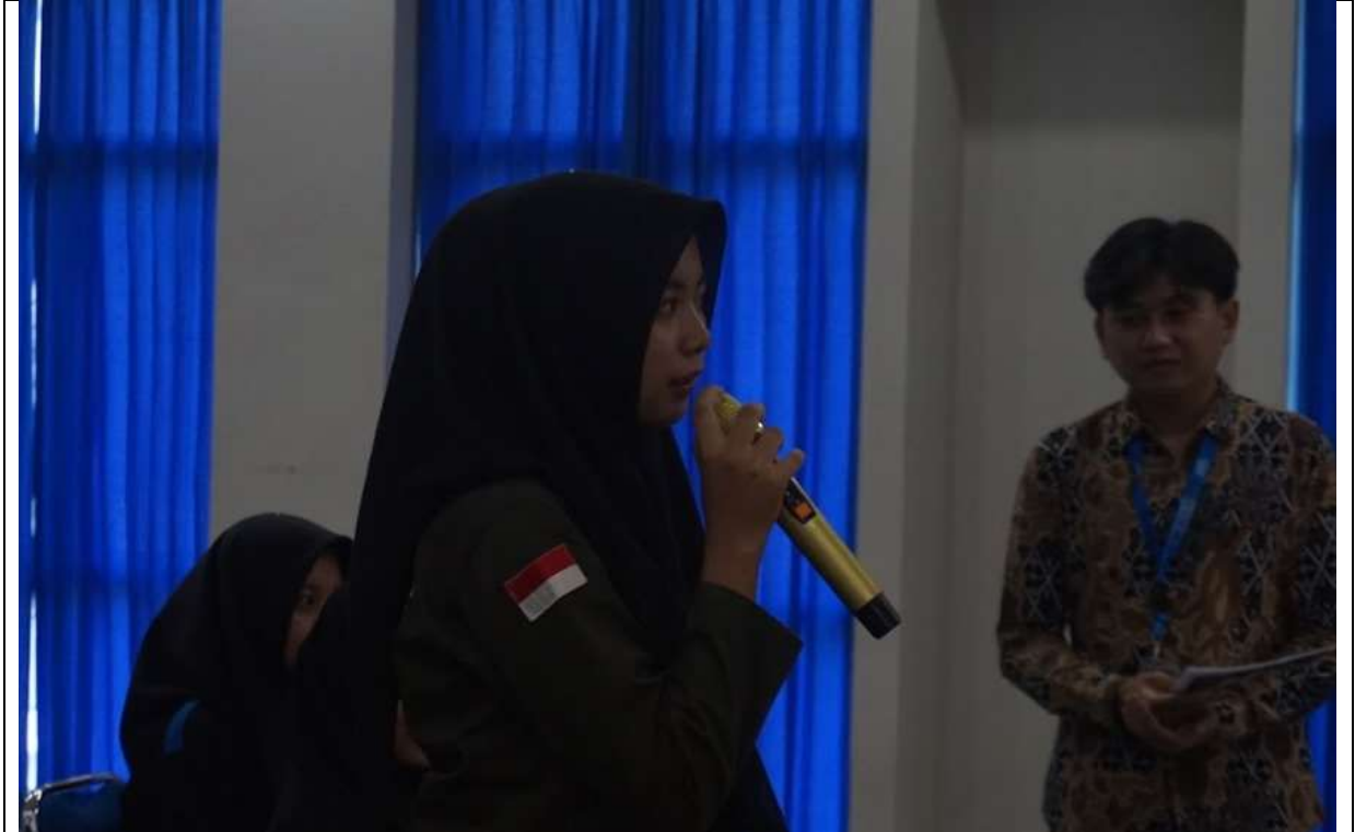
Gambar 6. Pemateri dengan 2 Nara Sumber di 2 Kelas yang berbeda