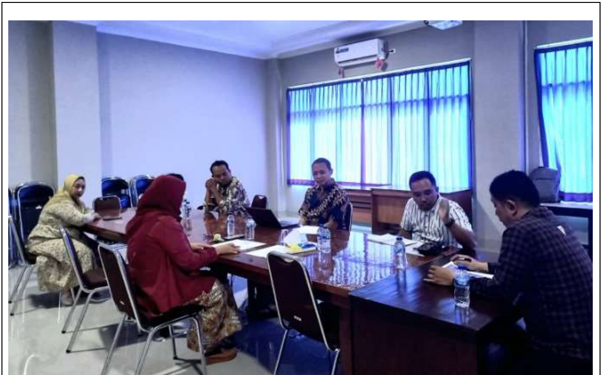
Gambar 1. Bermusyawarah menentukan mitra pelaksanaan kegiatan abdimasyarakat