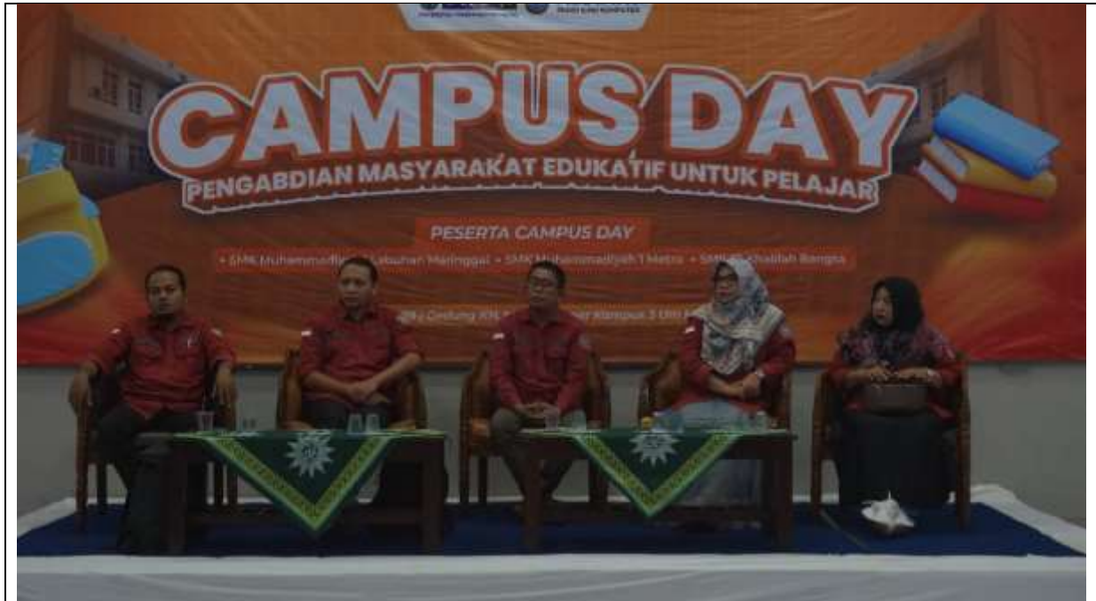
Gambar 5. Kegiatan Sesi Tanya jawab dengan Mitra pada saat kegiatan Pengabdian kepada masyarakat