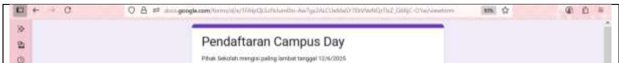
Gambar 3. Mitra mengisi kesediaan kehadiran