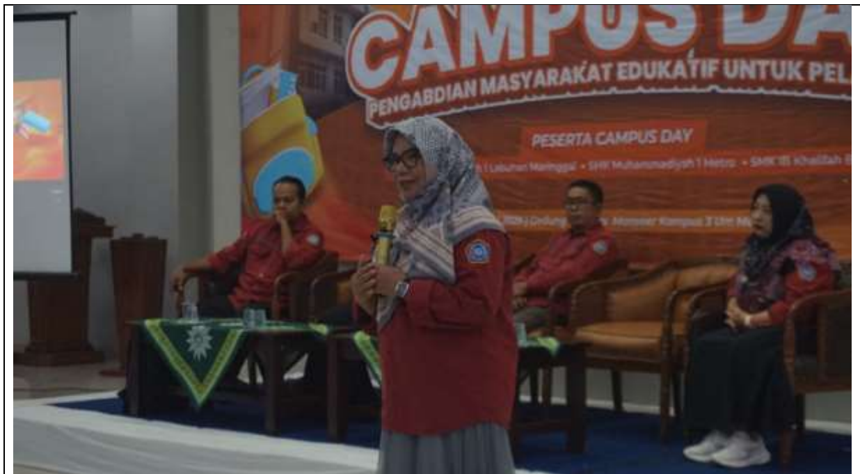
Gambar 4. Kegiatan Pembukaan Campus Day