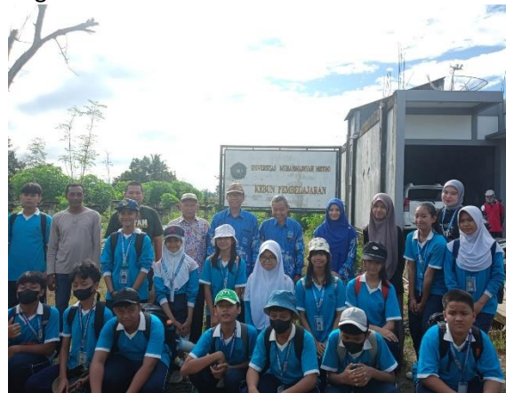
Gambar 7. Praktik di Kebun Pembelajaran UM Metro