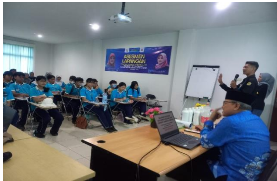
Gambar 4. Penjelasan Pembuatan Pupuk Organik Cair Pumakkal