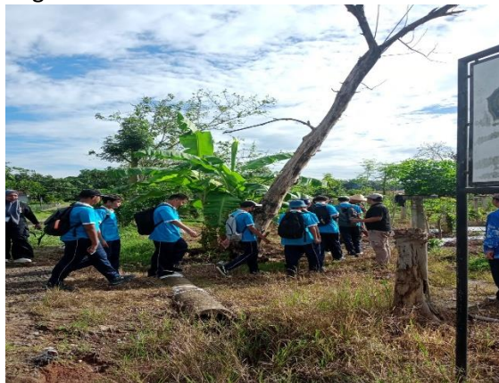
Gambar 6. Praktik Penanaman Cabe Jawa