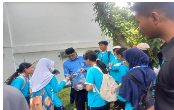
Gambar 3. Pembelajaran Di Lapangan