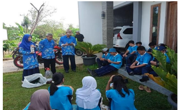
Gambar 5. Penjelasan Pembuatan Pupuk Organik Cair Pumakkal