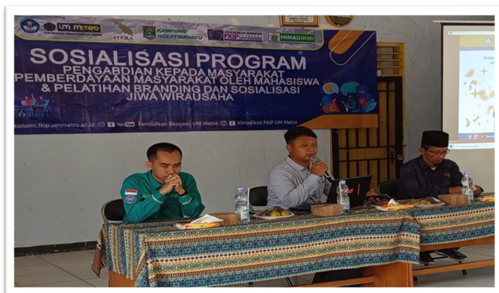
Gambar 1. Sosialisasi dan Koordinasi Progam Pengabdian

Tim pengabdian menyusun dan melaksanakan program pengabdian penerapan branding produk KWT Ngesti Rahayu sebagai strategi digital marketing melalui literasi ekonomi. Kegiatan ini dilaksanakan pada Hari Ahad, 11 Agustus 2024 di Aula Balai Kampung Ngesti Rahayu yang dihadiri oleh 44 peserta dari 2 KWT, yaitu KWT Cendana dan KWT Sekar Rahayu. Kegiatan diawali dengan pembukaan dan sosialisasi program oleh ketua tim pengabdian. Pada sesi pertama, peserta diberikan pemahaman mengenai pentingnya branding sebagai salah satu faktor penentu dalam meningkatkan daya saing produk di pasar. Dalam materi yang disampaikan, dijelaskan tentang konsep dasar branding, teknik membangun identitas merek yang kuat, dan cara membuat produk lebih dikenal oleh konsumen melalui platform digital.