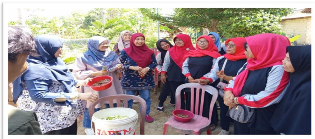
Gambar 4. Pelatihan Pengurus KWT dalam Membuat Pupuk Organik

Pemberdayaan KWT juga mencakup pelatihan dalam pembuatan pupuk organik secara mandiri. Sebelumnya, pengurus KWT menghadapi tantangan dengan harga pupuk yang mahal. Dengan pelatihan ini, anggota KWT dapat memproduksi pupuk organik sendiri, mengurangi ketergantungan pada pupuk komersial yang mahal, serta mendukung pertanian berkelanjutan di desa. Hal ini memungkinkan KWT untuk meningkatkan hasil pertanian mereka dengan biaya yang lebih efisien.