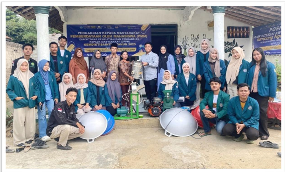
Gambar 2. Penyerahan Alat IPTEK Secara Simbolis kepada Mitra

Program pemberdayaan yang dilaksanakan di Desa Ngestirahayu berhasil meningkatkan kompetensi produksi Kelompok Wanita Tani (KWT). Salah satu hasil utama adalah peningkatan kuantitas produk yang dihasilkan oleh KWT Sekar Rahayu dan KWT Cendana. Pemberian alat produksi modern menggantikan peralatan manual yang selama ini digunakan, sehingga proses produksi menjadi lebih efisien dan menghasilkan produk dengan kualitas yang lebih baik. Dengan alat produksi yang lebih canggih, para anggota KWT dapat meningkatkan kapasitas produksi mereka untuk memenuhi permintaan pasar yang lebih besar.