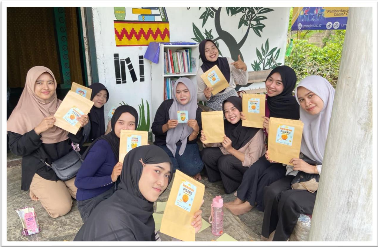
Gambar 3. Pelatihan pengemasan produk

Pemberdayaan KWT juga mencakup pelatihan dalam pembuatan pupuk organik secara mandiri. Sebelumnya, pengurus KWT menghadapi tantangan dengan harga pupuk yang mahal. Dengan pelatihan ini, anggota KWT dapat memproduksi pupuk organik sendiri, mengurangi ketergantungan pada pupuk komersial yang mahal, serta mendukung pertanian berkelanjutan di desa. Hal ini memungkinkan KWT untuk meningkatkan hasil pertanian mereka dengan biaya yang lebih efisien.