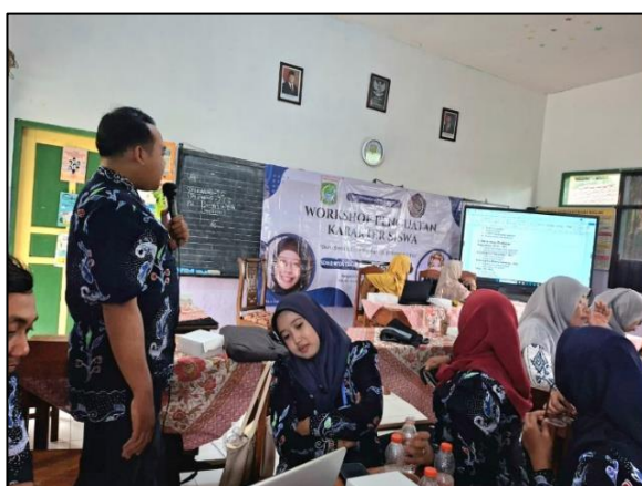
Gambar 5. Peserta melaksanakan presentasi hasil kegiatan pembuatan modul ajar