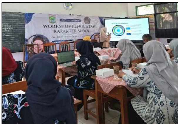
Gambar 3. Sesi pembuatan modul ajar dipandu oleh pemateri