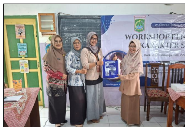
Gambar 6. Penyerahan karya siswa sebagai penerapan RPP kepada Kepala Sekolah