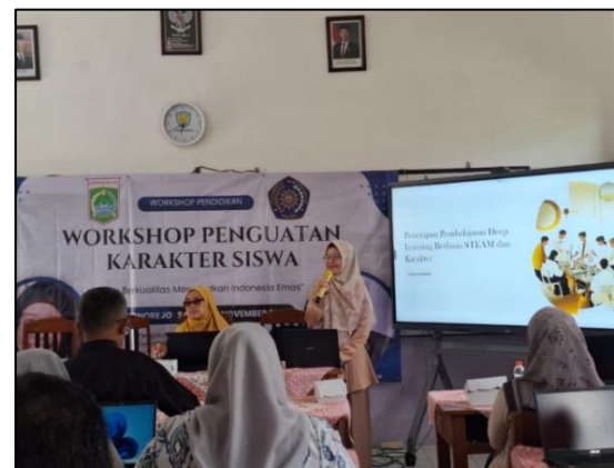
Gambar 4. Pembuatan Rencana Pelaksanaan Pembelajaran