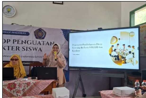
Gambar 2. Penjelasan materi dari narasumber kedua