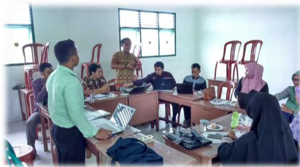
Gambar 4.5 Proses Klinik Artikel/Pengajuan Judul Artikel Ilmiah