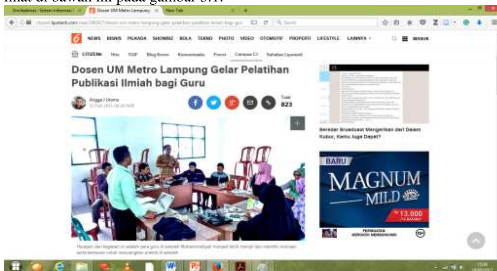
Gambar 3.1. Publikasi Pada Liputan6.com

Hasil kegiatan dari pengabdian ini di publikasikan dalam web: http://www.liputan6.com berikut laman web publikasi dalam web tersebut: http://citizen6.liputan6.com/read/2865627/dosen-um-metro-lampung-gelar-pelatihan-publikasi-ilmiah-bagi-guru . Berikut gambar laman dari laman web lihat di bawah ini pada gambar 3.1: