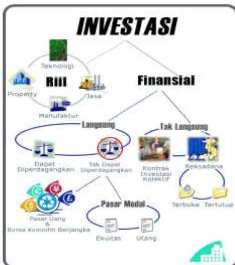
Gambar 2.1 Investasi

Secara sederhana, investasi dilihat dari wilayah atau obyek investasinya dibagi menjadidua yaitu sektor riil dan sektor finansial. Kedua sektor ini telah lama digeluti meski tentu saja sektor riil pada awalnya merupakan perintis awal dunia investasi.