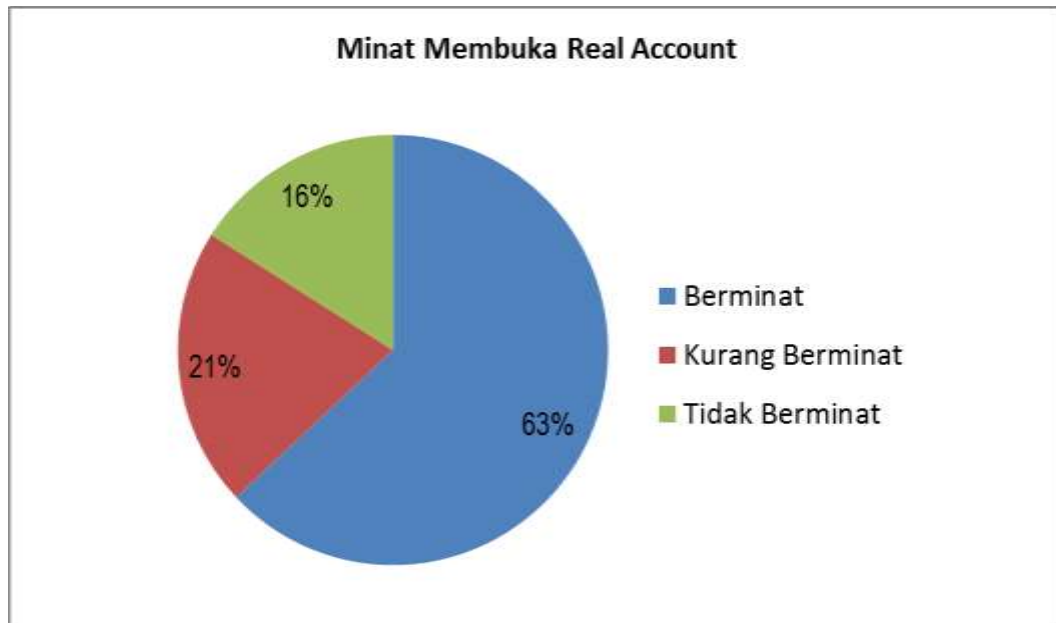
Gambar 4.2 Minat Membuka Real Account

materi yang di ajarkan, dan yang tidak memahami materi sebesar 9%, yang artinya sebanyak 3 peserta yang tidak memahami dengan materi yang di ajarkan.