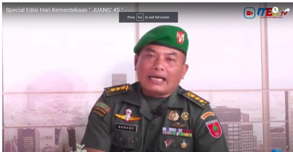
Gambar 5. Scene 4

Object: Penjelasan mengenai bentuk nasionalisme yang perlu dilakukan saat ini terutama oleh generasi muda dari para narasumber