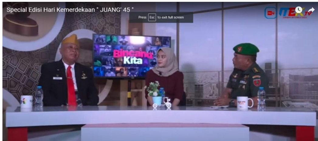
Gambar 6. Scene 5

bangsa sehingga sejajar dengan bangsa-bangsa lain. Peringatan Kemerdekaan RI yang ke 77 harus menjadi momentum untuk terus menerus mencintai negeri ini.