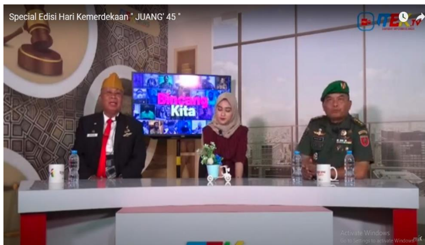
Gambar 2. Sign Scene 1

Object: Ketua DPD LVRI Sulawesi Tenggara memberikan informasi mengenai Sejarah Pembentukan LVRI di Indonesia. Intrepretation: Scene ini memperlihatkan sejarah pembentukan Legiun Veteran Republik Indonesia dari kumpulan pejuang Indonesia. mengintrepetasikan tentang pelaksanaan peringatan HUT Veteran RI sebagai bagian dari memperingati perjuangan para-Veteran terutama yang sudah meninggal dalam merebut serta mempertahankan Kemerdekaan RI. Kata Veteran sendiri dalam penjelasan ini diambil dari Kata Bahasa Yunani yang diartikan sebagai orang-orang yang berpengalaman. Kongres I menjadi cikal bakal pembentukan organisasi Legiun Veteran Republik Indonesia (2 Januari 1957) sesuai dengan Keputusan Presiden I Ir. Soekarno. Dalam penjelasan ini juga disebutkan bahwa LVRI merupakan salah stu organisasi yang AD-ARTnya ditanda tangani oleh Presiden RI.