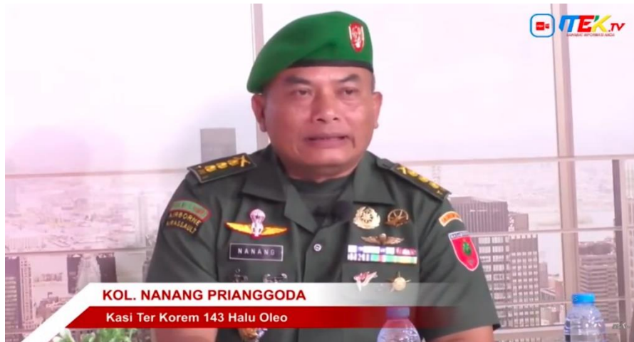
Gambar 3. Sign Scene 2

teknologi informasi malah menjadi tantangan yang bisa menjadi sumber perpecahan bagi Negara Kesatuan Republik Indonesia.