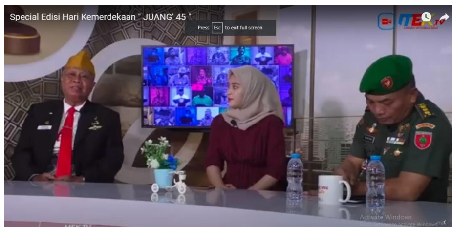
Gambar 4. Sign Scene 3

Object: Penjelasan mengenai peran veteran di Provinsi Sulawesi Tenggara dalam detik Proklamasi 1945. Intrepretation: Scene ini menggambarkan uraian penjelasan bahwa Veteran di Provinsi Sulawesi Tenggara turut berkontribusi dalam menyebarkan informasi mengenai Proklamasi Tahun 1945 pada seluruh masyarakat di wilayah Provinsi Sulawesi Tenggara, dimana informasi pada saat itu banyak ditutup-tutupi oleh Pemerintah Jepang yang menguasai Indonesia serta keterbatasan alat komunikasi yang digunakan pada saat itu. Uraian penjelasan mengenai kontribusi para veteran yang ada saat itu termasuk di wilayah Provinsi Sulawesi Tenggara menggambarkan nasionalisme yang luar biasa dari seluruh warga negara RI dimana saja berada.