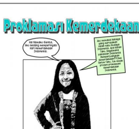
Gambar 1. COVER KOMIK Digital

Cover atau kulit luar komik merupakan identitas komik sekaligus cover dibuat sebagai gambaran isi dari komik. Cover komik yang dikembangkan memuat Nama judul dan gambar: