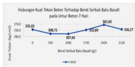
Gambar 4. Grafik Kuat Tekan Beton Terhadap Berat Serbuk Batu Basalt pada Umur 7 Hari

Beton struktural merupakan beton yang menerima beban struktur sehingga dalam pengerjaannya memerlukan perhitungan khusus dengan spesifikasi khusus material-material yang ada didalamnya. Beton jenis ini biasanya berada pada posisi pondasi, kolom, sloof, balok, plat lantai, tangga dan ringbalk. Sedangkan beton non-struktural merupakan beton yang tidak menerima beban struktural, Fungsinya hanya sebagai penguat biasa. Beton ini biasanya sebagai kolom praktis, balok lintel, kanopi, plat lantai dan lain-lain.