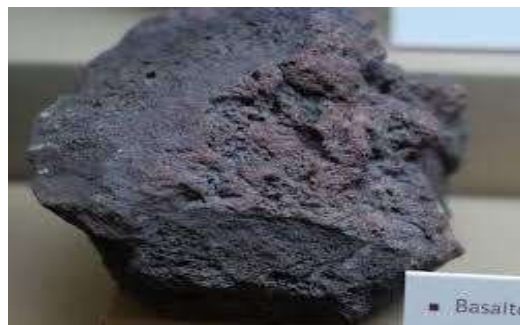
Gambar 1. Batu Basalt

Basalt adalah batuan beku vulkanik, yang terjadi dari hasil pembekuan magma berkomposisi basa di permukaan atau dekat permukaan bumi. Umumnya bersifat masif dan keras, bertekstur afanitik, terdiri atas mineral gelas vulkanik, plagioklas, piroksin, Amfibol dan mineral hitam.