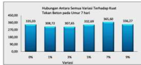
Gambar 3. Grafik Hubungan antar semua Variasi Campuran Terhadap Kuat Tekan Beton pada Umur 7 Hari