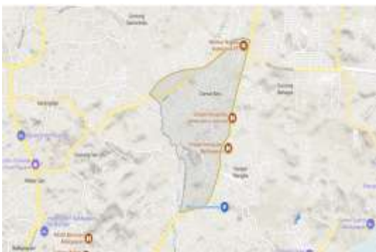
Gambar 1. Lokasi Kawasan Kelurahan Damai Baru

Lokasi studi kasus penelitian pada Kelurahan Damai Baru Kota Balikpapan (Gambar 1) dimana objek penelitian difokuskan pada saluran drainase yang terdapat pada kawasan tersebut.