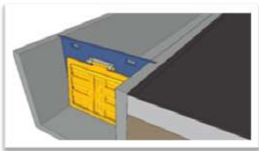
Gambar 6. Penerapan Pintu Klep Otomatis

Dalam membantu penerapan lapangan maka dilakukan suatu teknik pemodelan gambar secara 3 dimensi yang memadai dan penerapan ilmu pemograman yang tepat dikombinasikan ke aplikasi komputer untuk menggambarkan situasi yang sebenarnya dari proses desain karakter seperti disajikan pada Gambar 6.