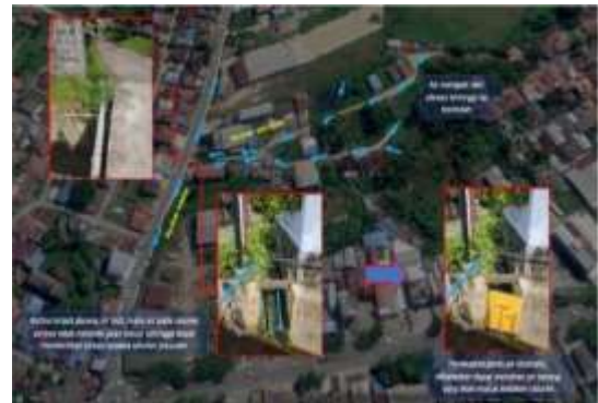
Gambar 2. Rencana pemasangan pintu air pada saluran drainase

Bentuk rencana pemasangan pintu air pada salah satu saluran drainase seperti pada Gambar 2. Lokasi tersebut merupakan kawasan rawan banjir dimana ketika hujan dengan intensitas tinggi air pada kawasan tersebut memberikan limpasan aliran yang cukup besar, namun disaat yang bersamaan terjadi kenaikan muka air sehingga kondisi aliran pada kawasan tersebut tidak dapat keluar bahkan mengalami tambahan volume air pada kondisi pasang dari saluran utama yang menyebabkan kawasan tersebut menjadi banjir dengan cukup tinggi.