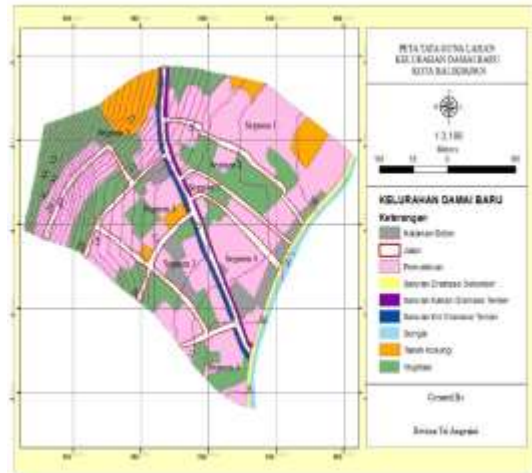
Gambar 4. Peta Tata Guna Lahan (Sumber: Ezra Hartarto Pongtoluran, 2023)

Kawasan daerah pengaliran didapatkan melalui digitasi menggunakan aplikasi ArcGIS yang hasilnya berupa peta tata guna lahan pada lokasi penelitian seperti pada Gambar 4.