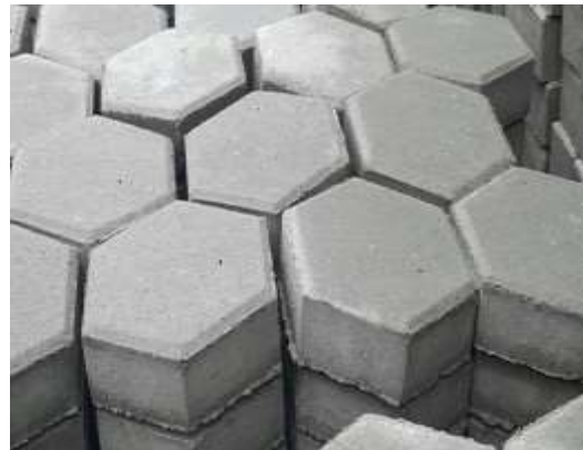
Gambar 1. Bentuk Paving Block Yang Akan Diuji

yang akan diteliti dapat dilihat pada gambar di bawah ini.