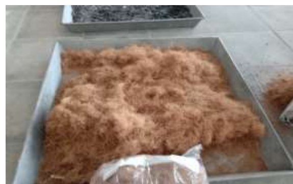
Gambar 2. Serat Sabut Kelapa