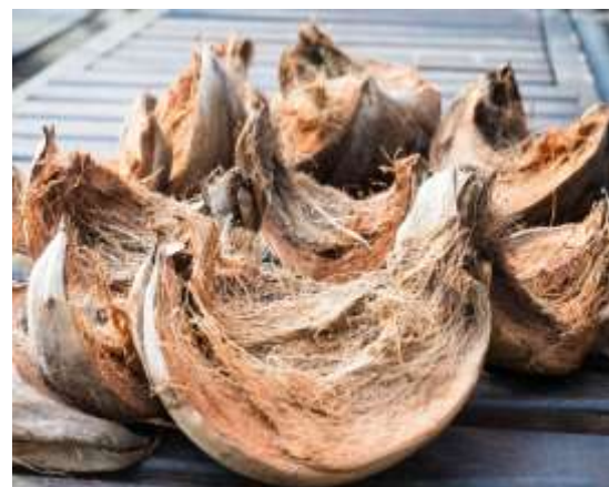
Gambar 1. Limbah Kulit Kelapa

permukaan terluar buah kelapa. Buah kelapa sendiri terdiri dari 35% sabut kelapa, 12% tempurung, 28% ampas dan 25% nira. Sabut kelapa terdiri dari 78% dinding sel dan 22,2% rongga. Salah satu cara untuk mengeluarkan serat dari sabut adalah dengan ekstraksi mekanis. Serat yang dapat diekstraksi adalah serat sabut kelapa 40% dan serat matras 60%. Dari segi teknis, sabut kelapa menawarkan sifat-sifat yang menguntungkan seperti panjang 15-30 cm, ketahanan terhadap serangan mikroba, pelapukan dan kerja mekanis (gosok dan tiup), dan bobot yang lebih ringan dari serat lainnya. Dalam dunia konstruksi, sabut biasa digunakan sebagai bahan tambahan dalam campuran beton. Pada penelitian sebelumnya, penambahan sabut dapat mempengaruhi kuat tekan yang dihasilkan. Kuat tekan beton dengan penambahan sabut kelapa menghasilkan kuat tekan yang lebih tinggi dibandingkan beton biasa.