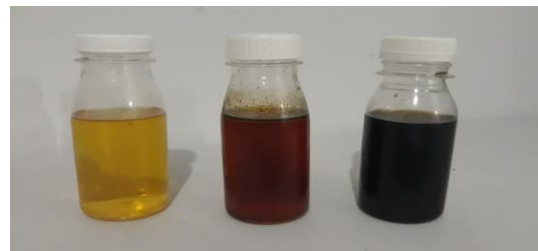
Gambar 2. Asap cair berbagai kualitas