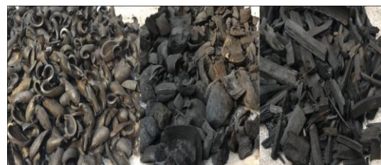
Gambar 3. Bioarang berbagai jenis