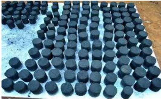
Gambar 4. Hasil briket bio-arang sekam