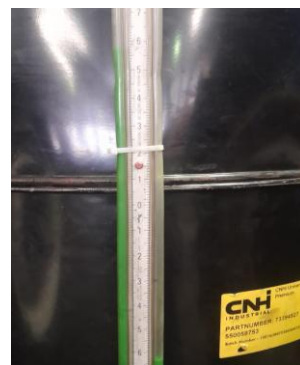
Gambar 3. Test blow-by pada rpm 1500