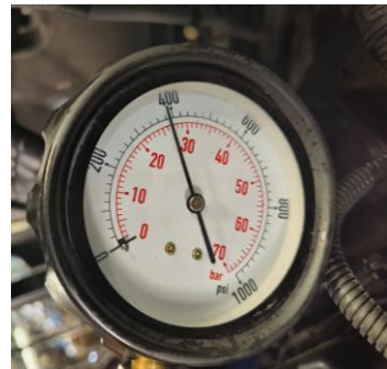
Gambar 9. Tes kompresi cylinder 6