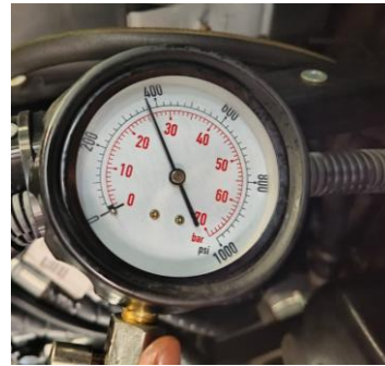
Gambar 8. Tes kompresi cylinder 5