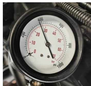
Gambar 4. Tes kompresi cylinder 1