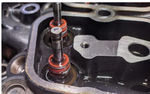
Gambar 11. Kondisi seal valve

Hasil overhaul berikutnya adalah seal valve , terdapat beberapa ring pada seal valve patah. Keadaan ini mengakibatkan terjadinya kebocoran pada seal valve yang bisa menyebabkan bahan bakar dan udara bocor tanpa terkendali ke dalam ruang bakar mesin[16]. Hal ini dapat meningkatkan tekanan di dalam ruang crankcase dan menyebabkan blow-by yang tinggi, di mana gas-gas pembakaran akan bocor ke dalam crankcase mesin melalui celah-celah yang ada antara piston dan silinder. Sebagai hasilnya, tekanan crankcase meningkat, menyebabkan blow-by yang lebih tinggi[9].