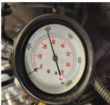
Gambar 7. Tes kompresi cylinder 4