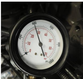
Gambar 6. Tes kompresi cylinder 3