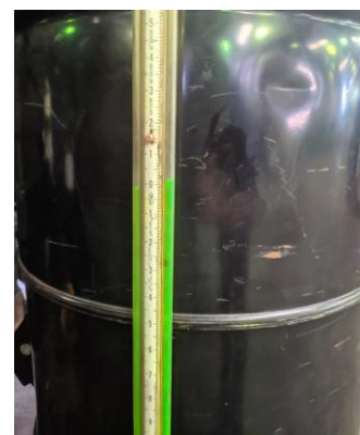
Gambar 12. Hasil Test Blow-by setelah Overhaul