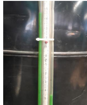
Gambar 2. Test blow-by pada rpm 800