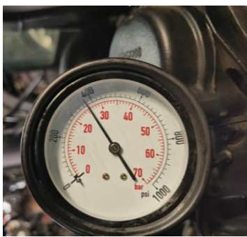
Gambar 5. Tes kompresi cylinder 2

Saat dilakukannya tes kompresi didapatkan hasil kompresi yang normal, ini menunjukkan bahwa tekanan kompresi dalam mesin stabil pada tingkat yang sesuai dengan standar normal, menandakan juga bahwa komponen-komponen dalam sistem pembakaran berfungsi dengan baik[11]. Kondisi ini mendukung kinerja mesin yang optimal, serta memastikan efisiensi bahan bakar yang baik dan minimnya potensi masalah yang terkait dengan tekanan kompresi yang tidak stabil[12]. Dapat dilihat pada Tabel 3 yang menunjukkan hasil tes kompresi.