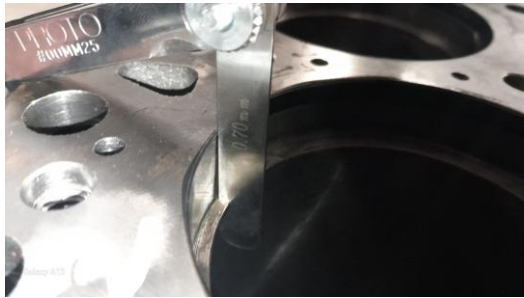
Gambar 10. Pengukuran Ring gap

Hasil overhaul berikutnya adalah seal valve , terdapat beberapa ring pada seal valve patah. Keadaan ini mengakibatkan terjadinya kebocoran pada seal valve yang bisa menyebabkan bahan bakar dan udara bocor tanpa terkendali ke dalam ruang bakar mesin[16]. Hal ini dapat meningkatkan tekanan di dalam ruang crankcase dan menyebabkan blow-by yang tinggi, di mana gas-gas pembakaran akan bocor ke dalam crankcase mesin melalui celah-celah yang ada antara piston dan silinder. Sebagai hasilnya, tekanan crankcase meningkat, menyebabkan blow-by yang lebih tinggi[9].