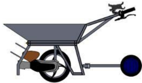
Gambar 1. Rancangan gerobak sorong bermesin

Desain gerobak sorong bermesin motor mio sporty 110 cc dapat dilihat di Gambar 1.