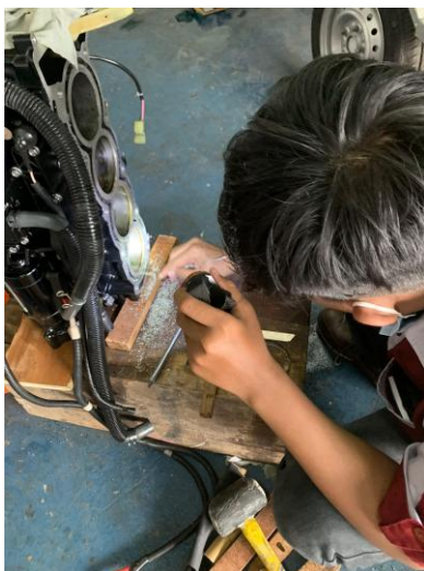
Gambar 4. Pembersihan Tiram

Perbaikan ini dilakukan dengan melakukan perakitan kembali pada komponen yang telah dilepaskan dengan memberikan cairan pendingin dan bahan bakar yang disesuaikan dengan spesifikasi pabrik yang terbaik [15].