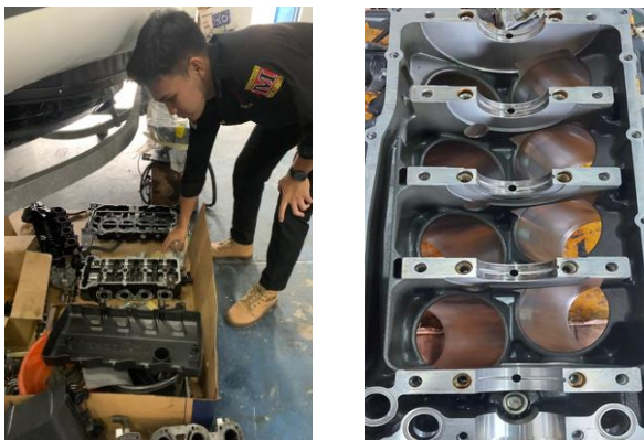
Gambar 1. Pembongkaran mesin speedboat

Pelepasan mesin speedboat dapat dilihat dari gambar berikut.