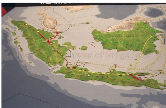
Gambar 7. Jaringan pipa gas trans sumatra

yang lebih stabil dan kompetitif, yang penting untuk meningkatkan daya beli dan kualitas hidup mereka [41]. Selain itu, proyek ini juga berkontribusi pada keamanan pasokan energi, mengurangi ketergantungan pada impor LPG dan memastikan pasokan yang lebih terjamin dari sumber domestik [42]. Dari perspektif lingkungan, gas bumi sebagai sumber energi lebih bersih dibandingkan dengan bahan bakar fosil lainnya, sehingga penerapan TSGP mendukung upaya pemerintah untuk mengurangi emisi karbon dan mencapai target net-zero emission [43].