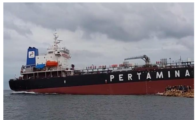
Gambar 3. Penyaluran gas melalui kapal tanker pertamina

Secara keseluruhan, pengembangan infrastruktur transportasi yang lebih baik dan efisien sangat penting untuk memastikan kelancaran distribusi energi di seluruh Indonesia, terutama dalam menghadapi tantangan geografis yang kompleks dari negara kepulauan ini.