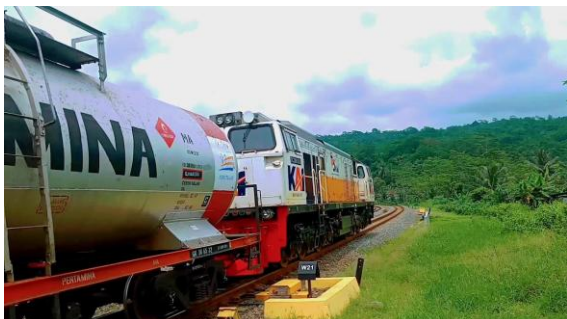
Gambar 4. Penyaluran energi melalui kereta api

menghubungkan tambang-tambang batubara di pedalaman dengan pelabuhan ekspor atau pusat-pusat distribusi, sehingga memfasilitasi pengangkutan batubara secara efisien. Penggunaan kereta api sebagai moda transportasi membantu mengurangi ketergantungan pada transportasi jalan raya, yang sering kali lebih mahal dan kurang efisien untuk komoditas energi berat seperti batubara [19]. Keunggulan kereta api dalam hal kapasitas angkut yang besar dan biaya operasional yang lebih rendah dibandingkan dengan truk menjadikannya pilihan yang lebih baik untuk transportasi batubara dalam jarak jauh. Penelitian menunjukkan bahwa infrastruktur perkeretaapian yang baik dapat meningkatkan pertumbuhan ekonomi wilayah dan mendukung pengembangan sektor energi [19]. Selain itu, dengan memanfaatkan jalur kereta api, pengangkutan batubara dapat dilakukan dengan lebih cepat dan aman, mengurangi risiko kerusakan yang mungkin terjadi selama transportasi [19]. Namun, meskipun ada keuntungan yang signifikan dari penggunaan kereta api, tantangan tetap ada, termasuk kebutuhan untuk meningkatkan infrastruktur dan memastikan bahwa jalur kereta api dapat diakses dengan baik dari lokasi tambang hingga pelabuhan. Oleh karena itu, investasi dalam pengembangan infrastruktur perkeretaapian di wilayah-wilayah penghasil batubara sangat penting untuk mendukung kelancaran distribusi energi di Indonesia [19].