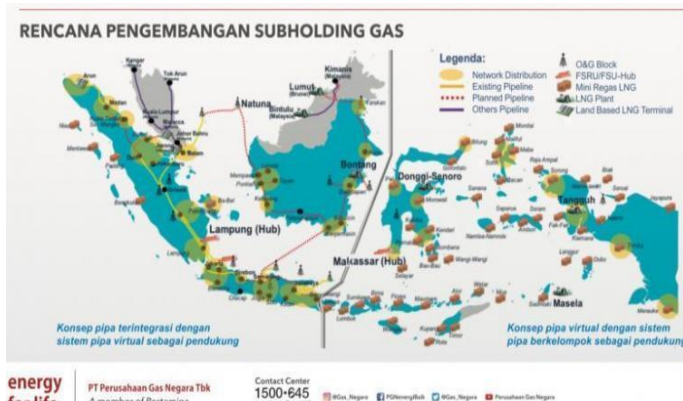
Gambar 1. Rencana pembangunan distribusi gas di Indonesia

Kondisi geografis Indonesia yang terdiri dari ribuan pulau dan memiliki distribusi populasi yang tidak merata semakin memperburuk tantangan dalam memastikan penyediaan energi yang merata di seluruh wilayah. Meskipun Indonesia memiliki potensi sumber daya alam yang melimpah, seperti gas alam dan batubara, banyak wilayah yang masih kesulitan untuk mendapatkan akses energi yang stabil dan terjangkau. Ketergantungan pada energi fosil yang tidak efisien dan biaya tinggi untuk transportasi energi ke daerah-daerah terpencil menjadi hambatan utama dalam meningkatkan ketahanan energi. Oleh karena itu, tantangan besar yang dihadapi Indonesia adalah menciptakan sistem distribusi energi yang dapat mengatasi kesenjangan antar wilayah, terutama di daerah-daerah yang belum terjangkau oleh infrastruktur energi yang memadai. Tujuan dari penelitian ini adalah untuk mengeksplorasi cara-cara yang dapat dilakukan untuk meningkatkan efisiensi transportasi dan distribusi energi di Indonesia, serta memberikan rekomendasi kebijakan untuk mengurangi ketergantungan pada energi fosil melalui