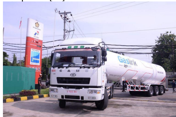
Gambar 5. Transportasi energi menggunakan truck

Selain itu, truk juga sering digunakan untuk mengangkut batubara dari tambang ke pelabuhan lokal. Pengangkutan batubara menggunakan truk memberikan fleksibilitas dalam hal rute dan waktu pengiriman, yang sangat penting mengingat kebutuhan untuk memenuhi permintaan energi yang terus meningkat di dalam negeri dan untuk ekspor [21]. Meskipun truk menawarkan banyak keuntungan, tantangan seperti kemacetan lalu lintas dan kerusakan jalan dapat mempengaruhi efisiensi transportasi [22].