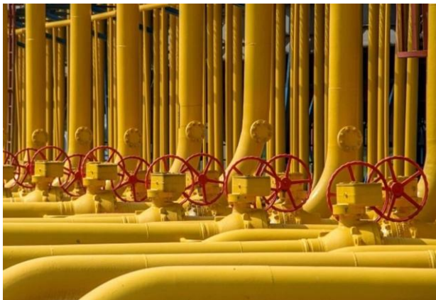
Gambar 2. Penyaluran Gas Melalui Pipa

pipa juga harus mempertimbangkan faktor-faktor seperti keamanan dan pemeliharaan, mengingat risiko kebocoran dan kerusakan yang dapat terjadi. Di samping pipa, transportasi energi fosil juga dilakukan melalui jalur laut dan darat. Pengangkutan batubara, misalnya, seringkali dilakukan menggunakan kapal tongkang yang mengangkut batubara dari lokasi tambang ke pelabuhan untuk diekspor atau didistribusikan ke pembangkit listrik [17]. Penggunaan moda transportasi yang beragam ini penting untuk memastikan pasokan energi yang stabil dan efisien di seluruh Indonesia, terutama mengingat tantangan geografis yang dihadapi oleh negara kepulauan ini. Secara keseluruhan, pengembangan infrastruktur transportasi energi yang lebih baik dan terintegrasi sangat penting untuk mendukung ketahanan energi di Indonesia. Investasi dalam infrastruktur yang lebih baik akan membantu mengurangi ketergantungan pada energi impor dan meningkatkan aksesibilitas energi bagi masyarakat di seluruh wilayah, terutama di daerah yang kurang terlayani [18].