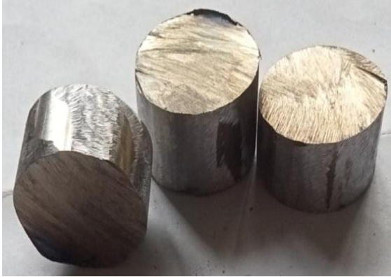
Gambar 2. Spesimen Baja Karbon Rendah

Adapun prosedur penelitian yang dilakukan pada penelitian ini adalah sebagai berikut :