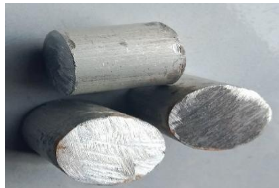
Gambar 1. Spesimen Aluminium

Spesimen pertama yang digunakan merupakan Aluminium 6061 terdiri dari 96,85 persen aluminium, 0,9 persen magnesium, 0,6 persen Silicon, 0,6 persen iron , 0,30 persen copper, 0,25 persen chromium, 0,20 persen zinc, 0,10 persen titanium, 0,05 persen mangan, dan hingga 0,05 persen unsur lain.