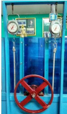
Gambar 4. Desain alat ukur Prony (torsi).

Dari penelitian yang dilakukan terhadap instalasi turbin dengan variasi ukuran diameter nosel turbin dimana nilai penunjukkan jarum skala putar dari kedua alat ukur neraca pegas merupakan jumlah gaya ( \Sigma F ) seperti ditunjukkan pada gambar 4, sedangkan data putaran turbin (rpm) didapatkan dengan menggunakan alat ukur tachometer, dan jari - jari pully diukur menggunakan penggaris sehingga diperoleh data penelitian seperti ditunjukkan pada tabel 1 sampai tabel 4.