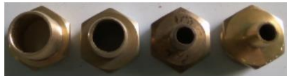
1 inchi \frac{3}{4} inchi \frac{1}{2} inchi \frac{1}{3} inchi Gambar 1. Variasi diameter nosel turbin