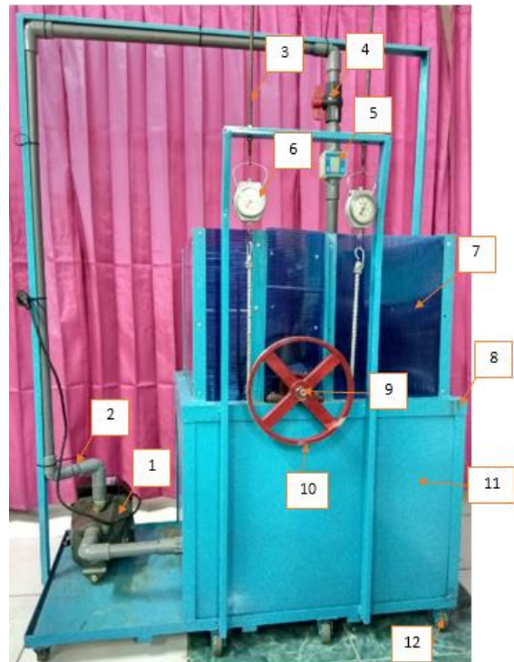
Gambar 3. Instalasi Penelitian.

Pada penelitian ini alat pengujian yang digunakan adalah turbin air pelton yang dilakukan di laboratorium Teknik Mesin Universitas Trunajaya Bontang. Instalasi alat penelitian seperti ditunjukkan pada gambar 3.