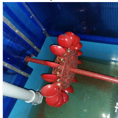
Gambar 2. Bentuk sudu sendok sayur