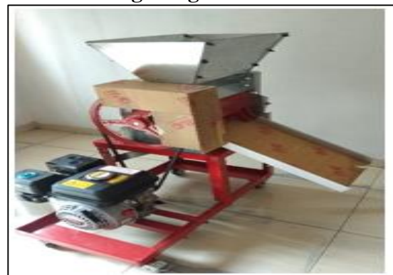
Gambar 4. Hasil Rancang Bangun