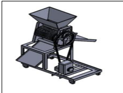
Gambar 2. Konsep Desain Alat

Setelah mengetahui alur rancangan penelitian, maka desain yang sudah direncanakan akan dibuat menggunakan software solidwork . Berikut hasil desain yang direncanakan: